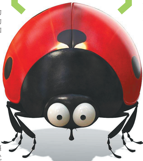
《昆虫总动员》里的瓢虫。

要大开杀戒。为了摆脱蚱蜢的控制,争取生存自由,小蚂蚁们齐心协力站出来反抗,最终除掉作恶多端的“霸王”,蚂蚁岛终于迎来和平美好的生活。弱肉强食、压迫与反抗,这个人类世界的重要主题,在昆虫世界也表现得淋漓尽致。