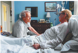
厄尔·斯通(图左,克林特·伊斯特伍德饰)与妻子。

厄尔·斯通曾经想用金钱证明自己存在的价值。“我可以用金钱买下一切,除了时间。”在接受法庭审判后,厄尔·斯通对自己的女儿懊悔地说。他曾经背离亲人,最终又幸运地找回亲情。因为犯罪,他受到惩罚失去自由,这也让他重新开始审视自己的人生。那是一个浪子重新回归家庭的故事。 年轻的时候,厄尔·斯通放荡不羁,他的爱好比参加女儿的婚礼更重要。他第一次试图回归家庭时,被家人赶了出来。厄尔·斯通以为那是因为贫穷的缘故,当时的他是一个身无分文的破产老人。为了证明自己的价值,他铤而走险去当“骡子”。他尽心尽力想做一个称职的外祖父,为外孙女的婚礼派对买单,为她支付学费。但是,女儿并没有原谅厄尔·斯通,直到他舍弃性命和金钱,在家人最需要的时候出现在他们面前。 在影片的最后,厄尔·斯通冒着被毒贩处决的危险回到家里,陪伴妻子走完人生最后一程,这是电影中最催泪的地方。倔强顽固的老男人展现了自己内心柔软的一面。病床上的妻子对厄尔·斯通说:“你是我一生所爱,也是我一生所痛。”此时,厄尔·斯通才明白这一生他失去了什么。他应该为自己的家人投入更多时间和精力。 妻子临终前告诉厄尔·斯通,“一个人爱不爱自己的家人不应该用金钱去衡量。只有陪伴才是最珍贵的,千金不换。” 这部影片中有很多类似的心灵鸡汤。但是,克林特·伊斯特伍德处理得真诚而不做作,这位耄耋老人发自肺腑的感慨令人信服。厄尔·斯通在餐厅里与追捕自己的探员探讨人生哲理。他告诫探员不要重蹈自己的覆辙,应该把家庭放在第一位,否则就会像他一样后悔。他对监视自己的毒贩说:“这些人根本不在乎你,你可以金盆洗手,去找一份真正喜欢的工作。”这些都是生命沉淀下来才会懂得的道理。