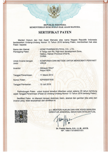
康芝药业取得印度尼西亚专利证书。

射用苏拉明钠”药物临床试验批件。如临床试验成功并获许生产，苏拉明钠将成为全球首个治疗手足口病的新药。 据悉，由康芝药业研发的苏拉明钠治疗手足口病新适应症此前通过PCT申请国际发明专利，已先后在中国、日本、新加坡和美国获得发明专利授权。此次新增印度尼西亚专利授权，将有利于进一步发挥公司的自主知识产权优势，提升公司核心竞争力，推动手足口病治疗药物研究。 (撰文/华乐)