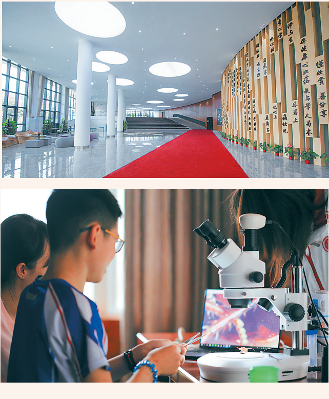
① 北大附小海口学校学生在写生画画。 ② 北大附小海口学校综合大楼大厅。 ③ 北大附中海口学校学生进行课程实验。