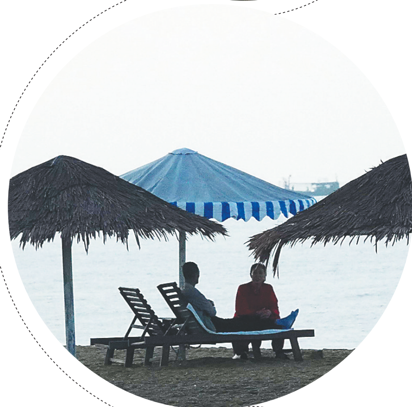
大力推进全域旅游建设的东方受到游客青睐。