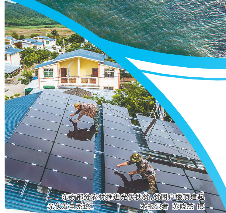
东方部分农村推进光伏扶贫，贫困户楼顶建起光伏发电系统。