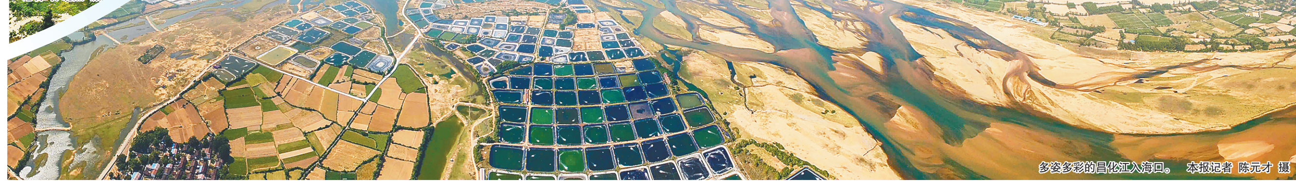
多姿多彩的昌化江入海口。