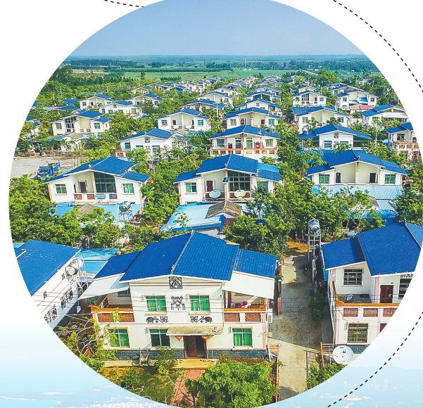
大广坝水库移民危房改造村——大田镇报日村新貌。