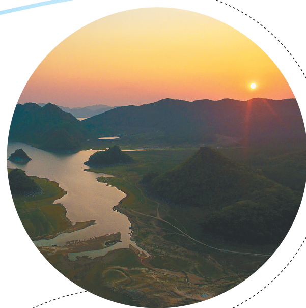
夕阳余晖下的俄贤岭。