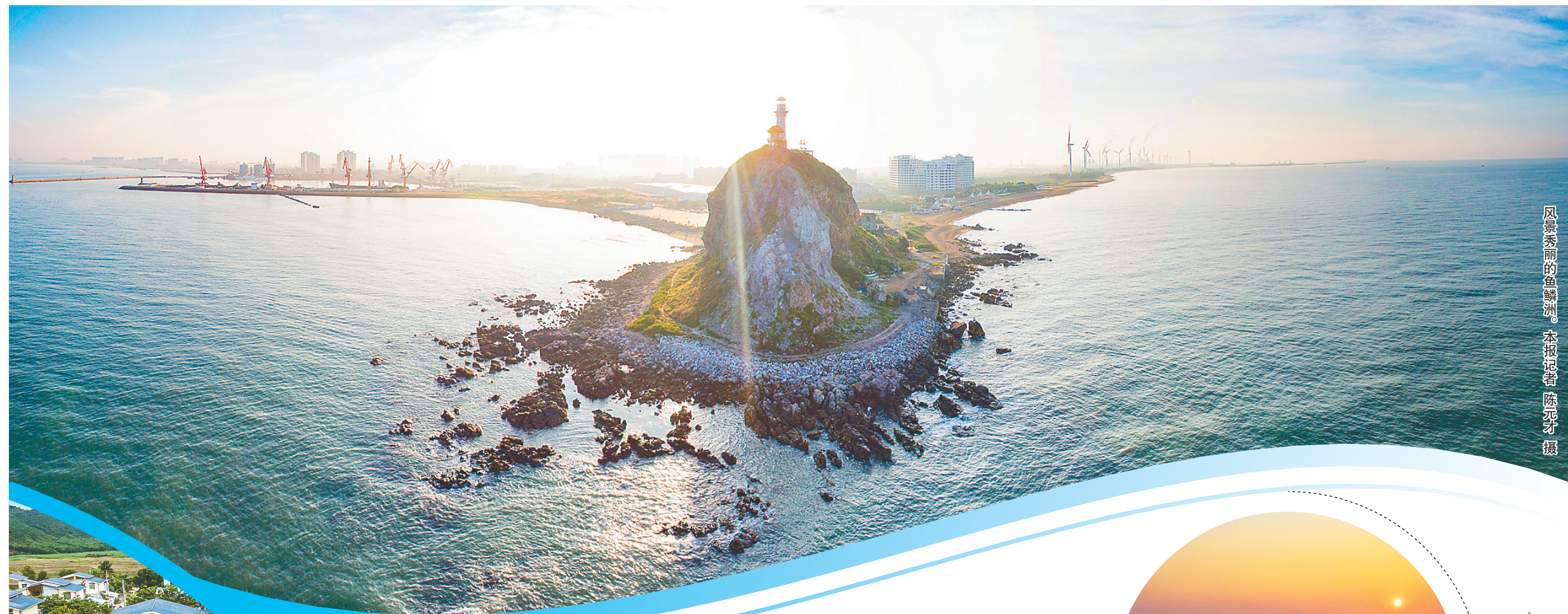
风景秀丽的鱼鳞洲。