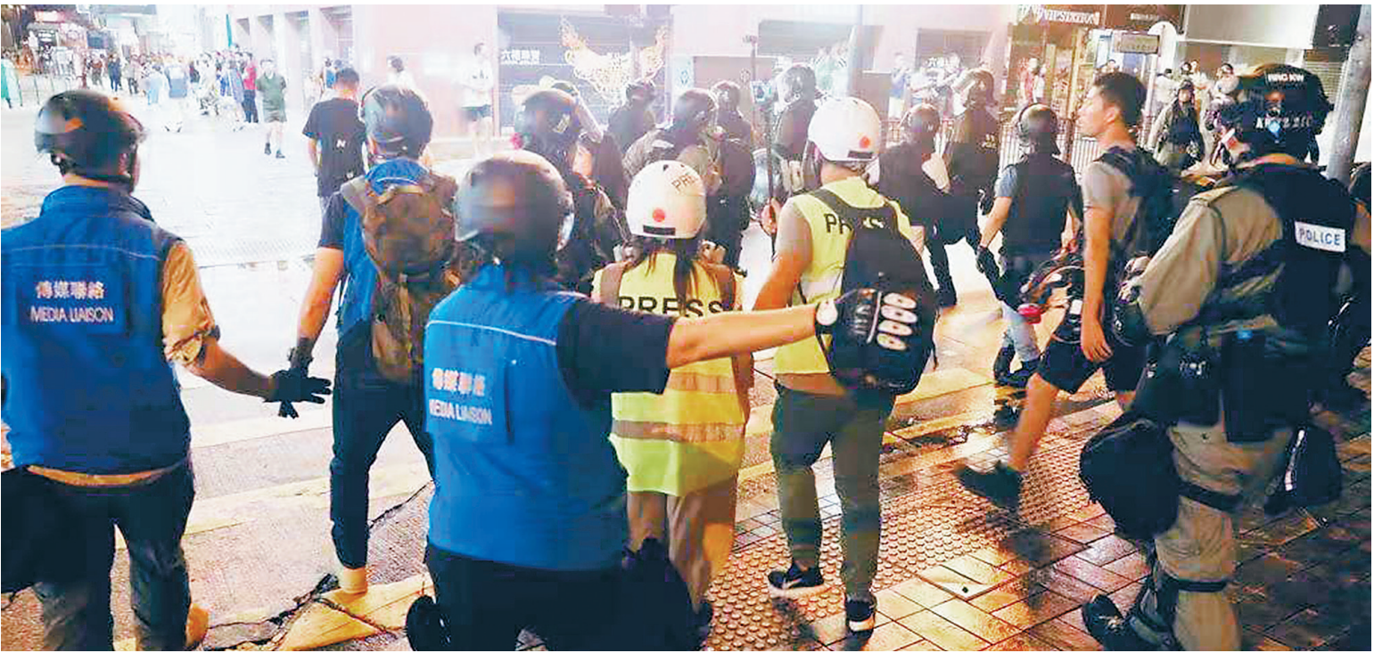
“蓝背心”在工作现场（资料照片）。