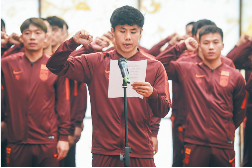
9月7日，新任国家队队长蒿俊闵(前)带领队友面向国旗宣誓。