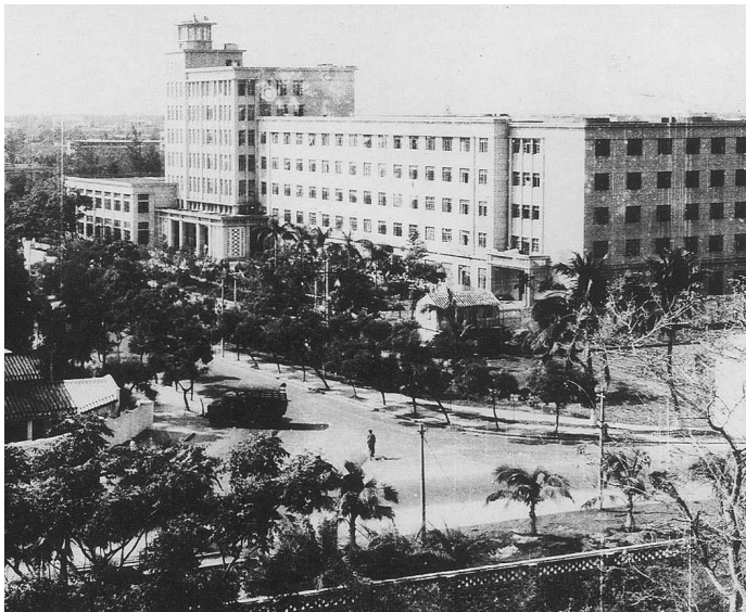
上世纪60年代的华侨大厦,是当时海口的地标性建筑,也是海口最高级的酒店。