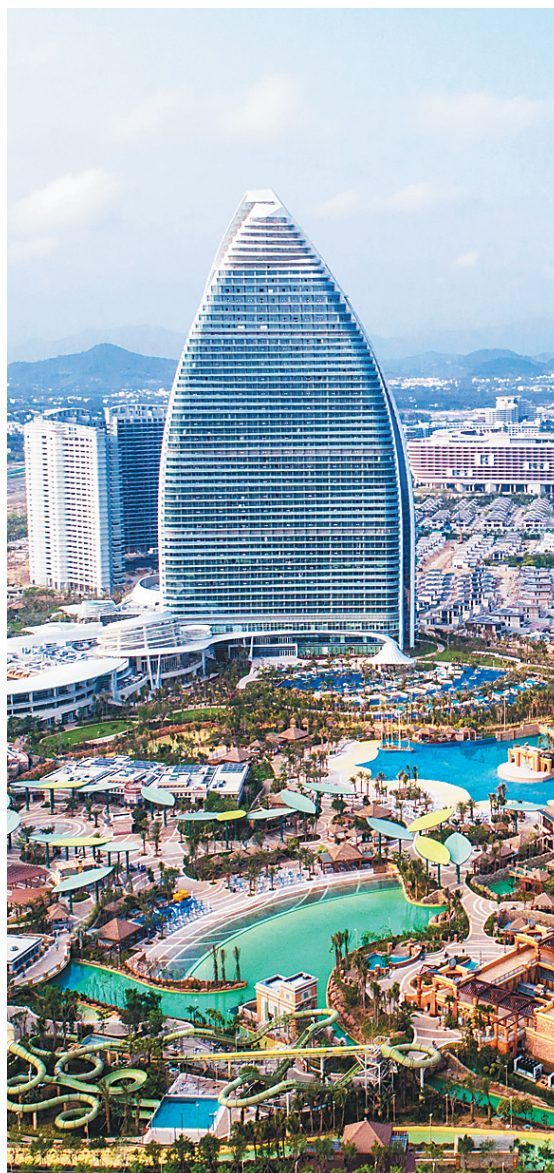
三亚·亚特兰蒂斯旅游度假综合体。