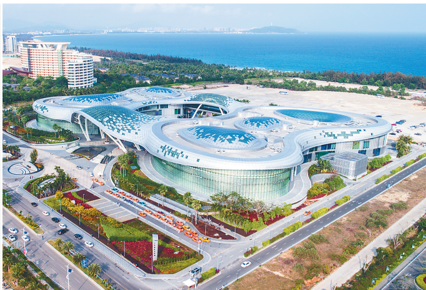
坐落于三亚海棠区的三亚国际免税城。

多年来,我省依托得天独厚的自然生态优势,持续擦亮“旅游”这张最靓名片。而我省旅游业的发展,从旅游标志性建筑中可窥一斑。(本报海口9月10日讯)