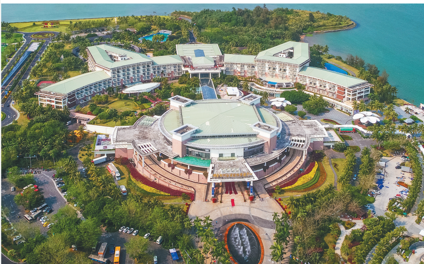
博鳌亚洲论坛国际会议中心。