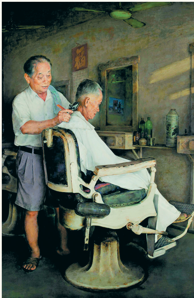
《祥和的日子》(油画) 梁峰 作

发型不仅是人们的头发样式,也是潮流的象征。过去70年里,从走村入户的剃头师傅、街头巷尾的理发店,再到城市中装修华丽、设备先进的发型设计室或美发店,从千篇一律的剪头发到造型设计,从“黑长直”到“波浪卷”,从追逐某一爆款发型再到如今各种发型“百花争艳”,理发行业的发展,反映出社会思维方式和审美观念的变化,折射出时代的变迁。