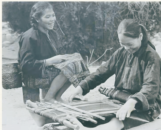
海南省民族博物馆展出的老照片。