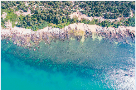
昌江棋子湾风景如画。

守护好这片绿水青山，树牢绿色发展理念的昌江，也从优势生态中收获了发展的“绿色”动力。