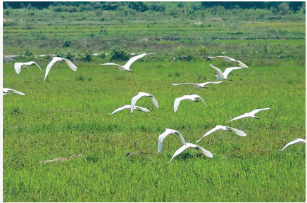
昌江昌化镇的一片田洋里白鹭飞舞。