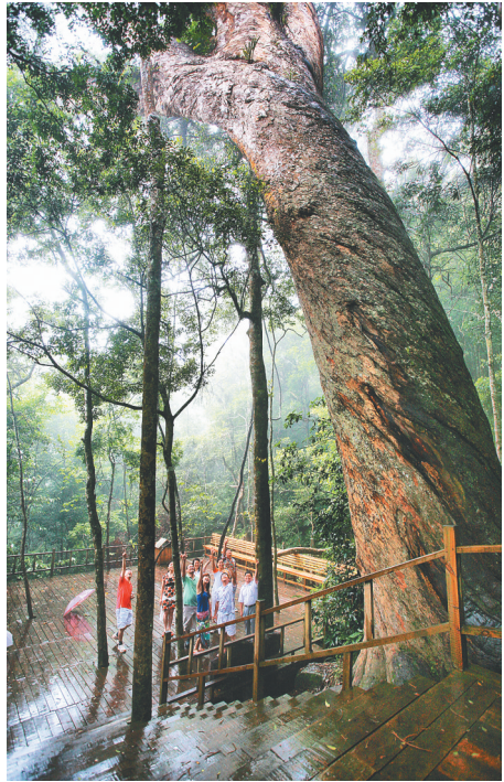
游客在霸王岭游玩。