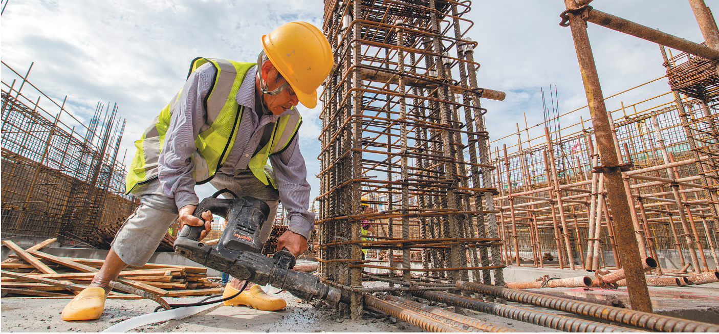
9月18日上午,海南自由贸易试验区建设项目(第六批)集中开工和签约三亚分会场活动在三亚市体育中心项目(体育场)现场举行。图为当天上午,在三亚市体育中心项目工地,工人正在施工。

当天签约的企业中,海南炼化、汉地环境科技集团、保利通信等都是都已落户洋浦的企业,这些企业将在洋浦进一步扩大投资,带来新的项目。湖南中大检测技术集团公司、广西南宁聪海海鲜批发交易市场公司等,带来洋浦中大海南智能传感器及终端生产基地、国际海产品及冻品产业园等代表洋浦高新技术、航运枢纽、物流仓储产业发展的标志性项目,将为加快洋浦开发开放作出新贡献。杭萧钢构股份公司是中國钢结构行业第一家上市企业,产品和服务已达全球50多个国家和地区,以“一带一路”沿线国家,尤