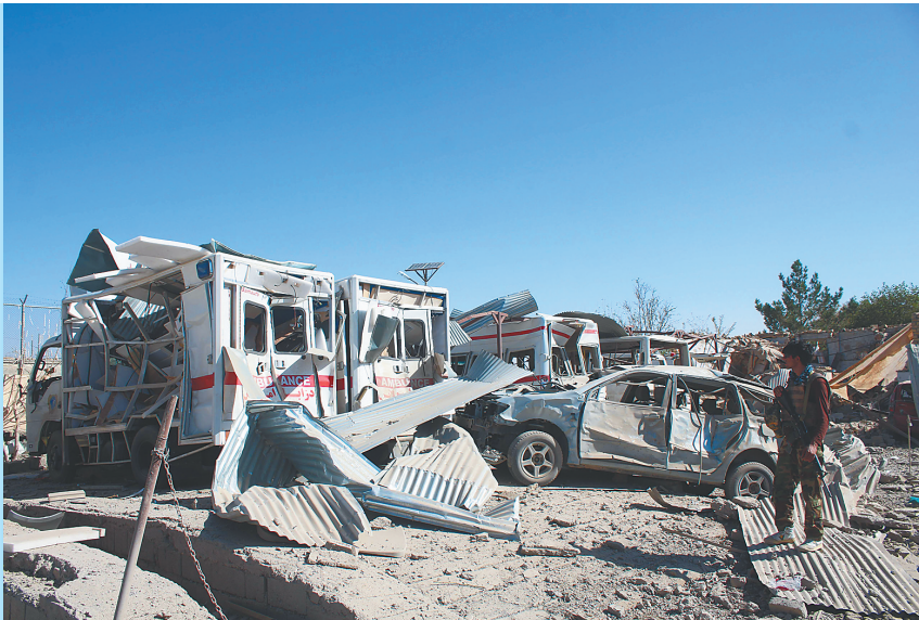
阿富汗内政部发言人纳斯拉特·拉希米19日说，阿富汗南部查布尔省首府卡拉特市当日发生一起汽车炸弹袭击事件，造成15人死亡，66人受伤。图为汽车炸弹袭击事件现场。