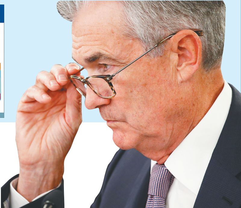
美国联邦储备委员会主席鲍威尔在新闻发布会上。

更多分析人士预计，继7月和9月两次降息后，美联储或在今年内继续下调利率水平。高盛集团经济学家预计10月美联储将做出年内第三次降息决定，全年降息幅度将是75个基点。摩根士丹利经济学家也认为，美联储在10月再降25个基点的可能性