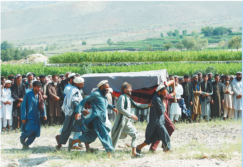
阿富汗警方19日说，北约驻阿联军18日在阿富汗东部楠格哈尔省发动无人机空袭，造成18名平民死亡。图为亲和民众为一名空袭遇难者举行葬礼。