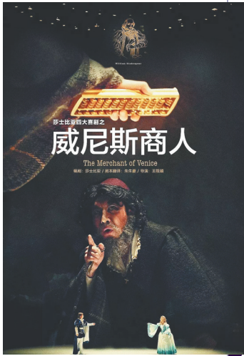
戏剧《威尼斯商人》海口演出海报。

海南的商业演出市场相较于内陆城市发展较慢,但春去秋来,多年耕耘的土地总有发芽的时刻。从2018年下半年开始,海南各类商业演出有了明显增加。近日,海南日报记者采访演艺经纪公司负责人、观众等,试图勾勒出当下我省商演市场的“轮廓”。