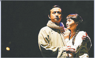
话剧《暗恋桃花源》剧照。