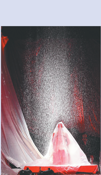
话剧《恋爱的犀牛》剧照。

毋庸置疑的是,海南在培育演出消费市场过程中,需要文化企业、观众、剧院剧场等产业链上各个方面的“全员参与”,以此创造更为有序、成熟的演出环境,培育更加富有营养的文化土壤。