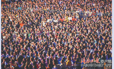
2018年张学友海口演唱会现场人气火爆。