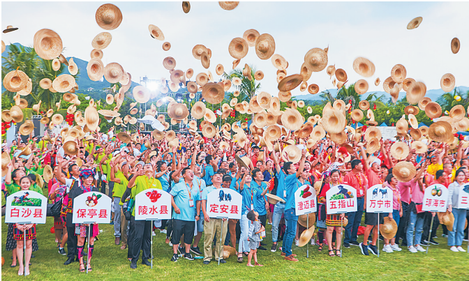
我省“中国农民丰收节”庆祝活动三亚主会场，全省各市县农民代表欢庆自己的节日。