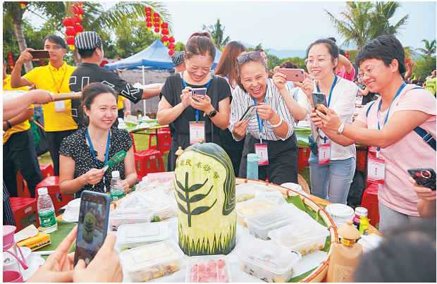
我省“中国农民丰收节”庆祝活动三亚主会场，特色丰富的公道饭吸引市民游客拍照留念。