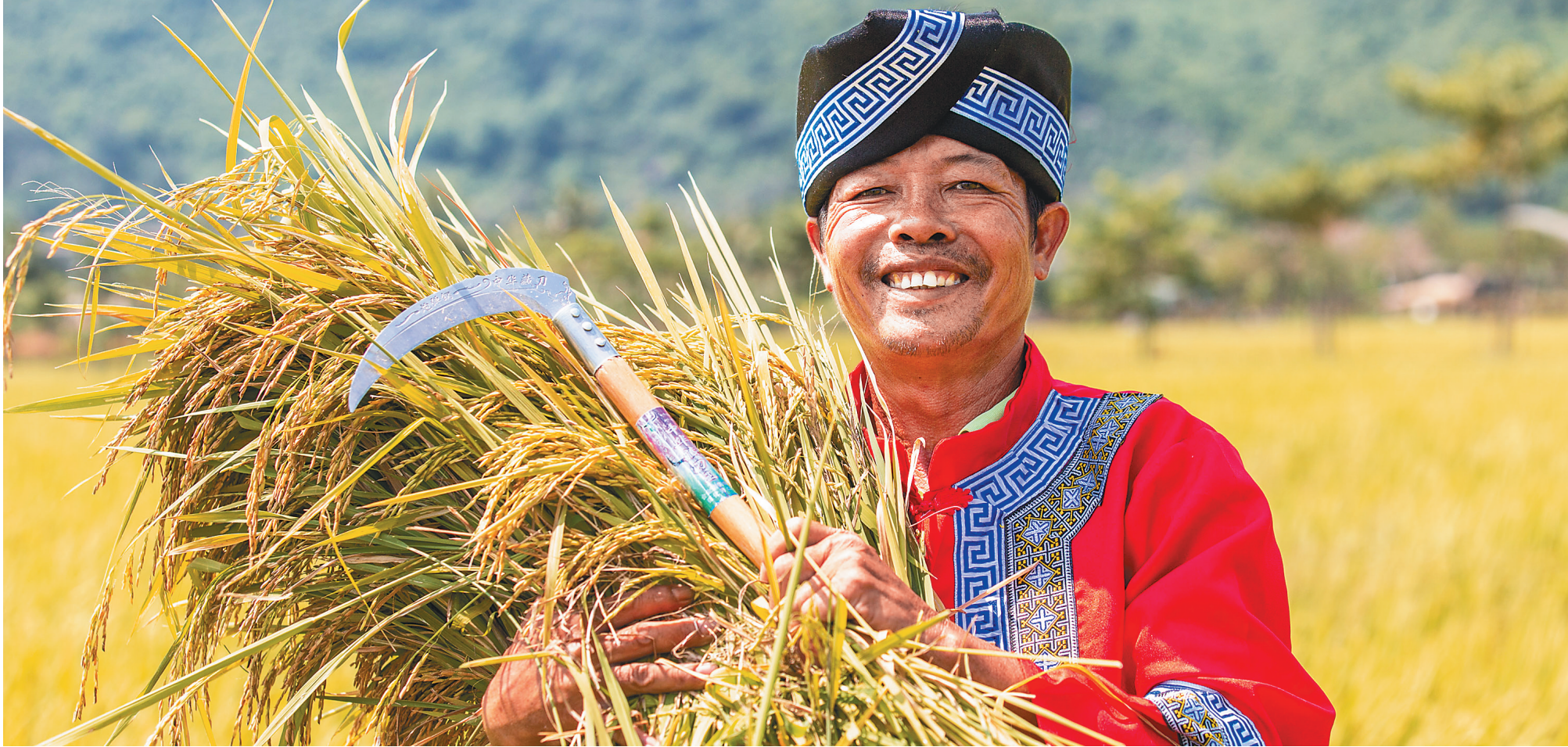
9月23日，在三亚水稻国家公园，农民捧起丰收的稻谷。

本报三亚9月23日电（记者孙慧 陈雪怡）9月23日是我国传统节气秋分，也是第二个“中国农民丰收节”，全省多个市县举办庆祝活动。在三亚主会场，来自全省约1000名农民代表齐聚亚龙湾国际玫瑰谷，一起劳动比赛，载歌载舞，庆祝自己的节日，享受丰收的欢乐。 今年的丰收节，海南庆祝活动以“庆祝丰收、弘扬文化、振兴乡村”为宗旨，展示海南科技强农新成果、产业发展新成就、乡村振兴新面貌。