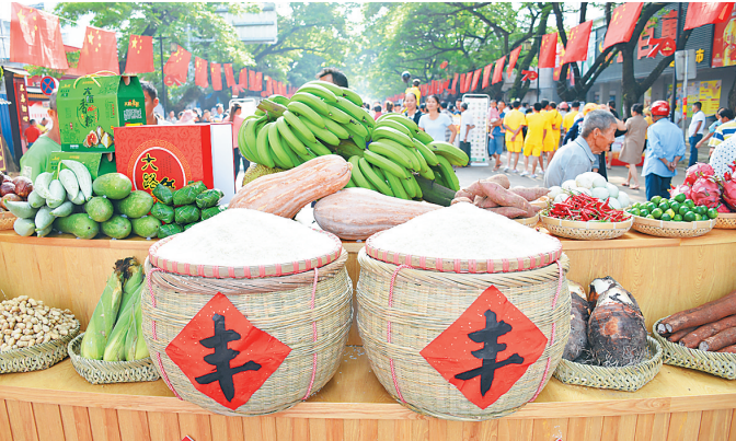
琼海市庆祝“中国农民丰收节”会场展示的琳琅满目的农产品。