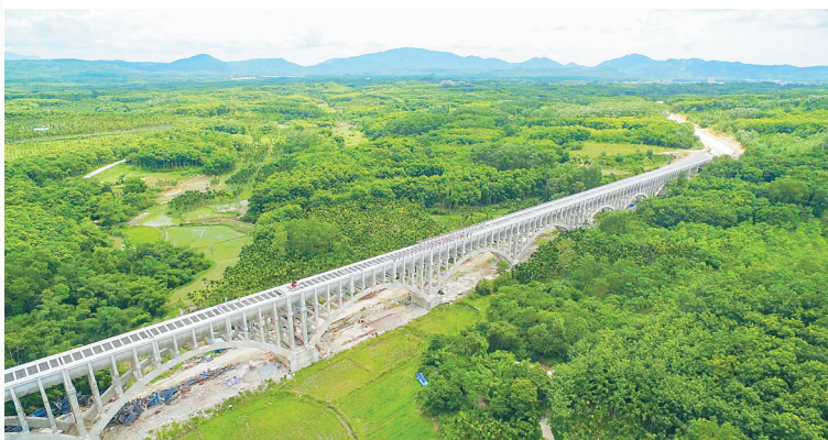
红岭灌区工程总干二标号渡槽。