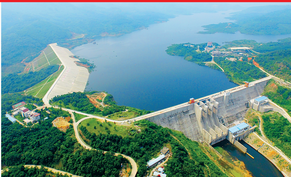
琼中红岭水利枢纽工程。