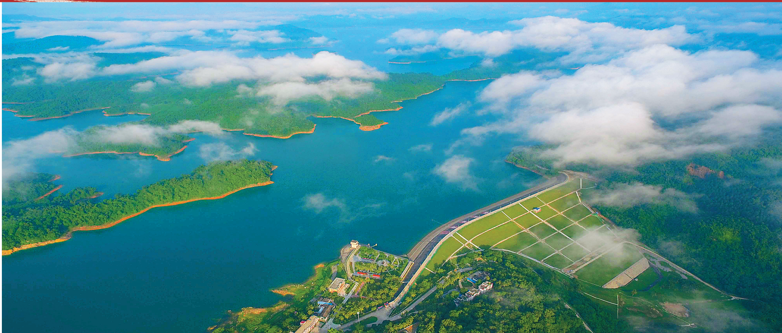
俯瞰松涛水库大坝。