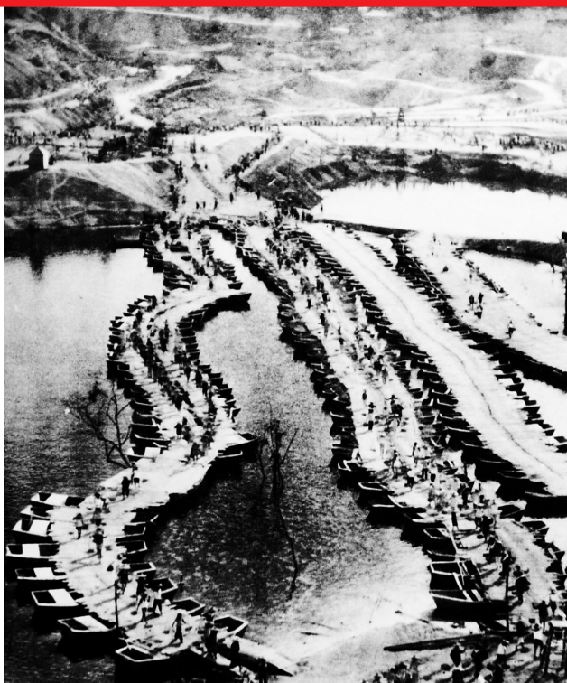
一九五八年,松涛水库建设场景。(本报资料图片)