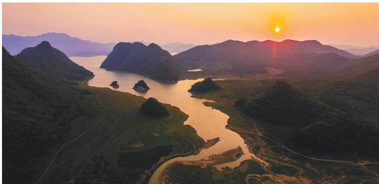
晚霞映照下的东方市大广坝水库。