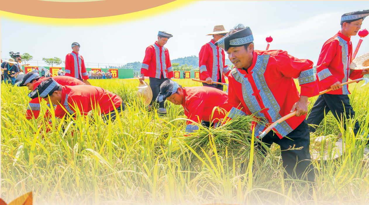
9月23日,三亚水稻国家公园举办以“庆丰收 迎国庆”为主题的中国农民丰收节庆祝活动,在稻田里举办庆丰收开镰仪式。