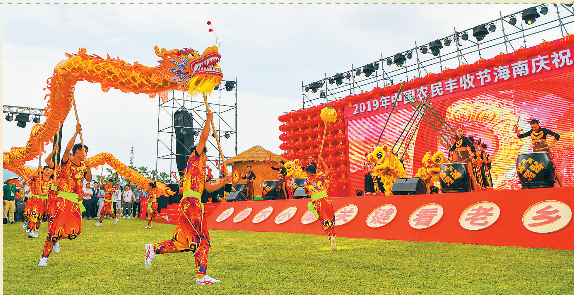
9月23日,在三亚市国际玫瑰谷,全省2019年“中国农民丰收节”开幕式上的舞龙舞狮表演。