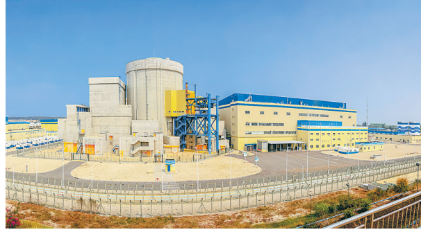
昌江核电站。

活动地点:石碌镇保突村 活动时间:10月1日—30日 活动内容:在石碌镇保突村制陶馆,布置黎族原始制陶品展示区和体验区。通过活动让游客了解黎族悠久的历史文,体验黎族传统制陶技艺乐趣。