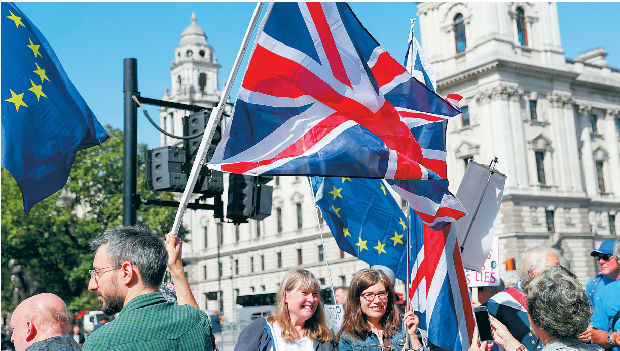
近日，在英国伦敦，抗议和赞成“无协议脱欧”的人们在议会大厦外聚会。