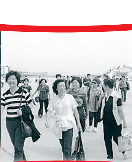
1999年国庆期间登岛的旅客。