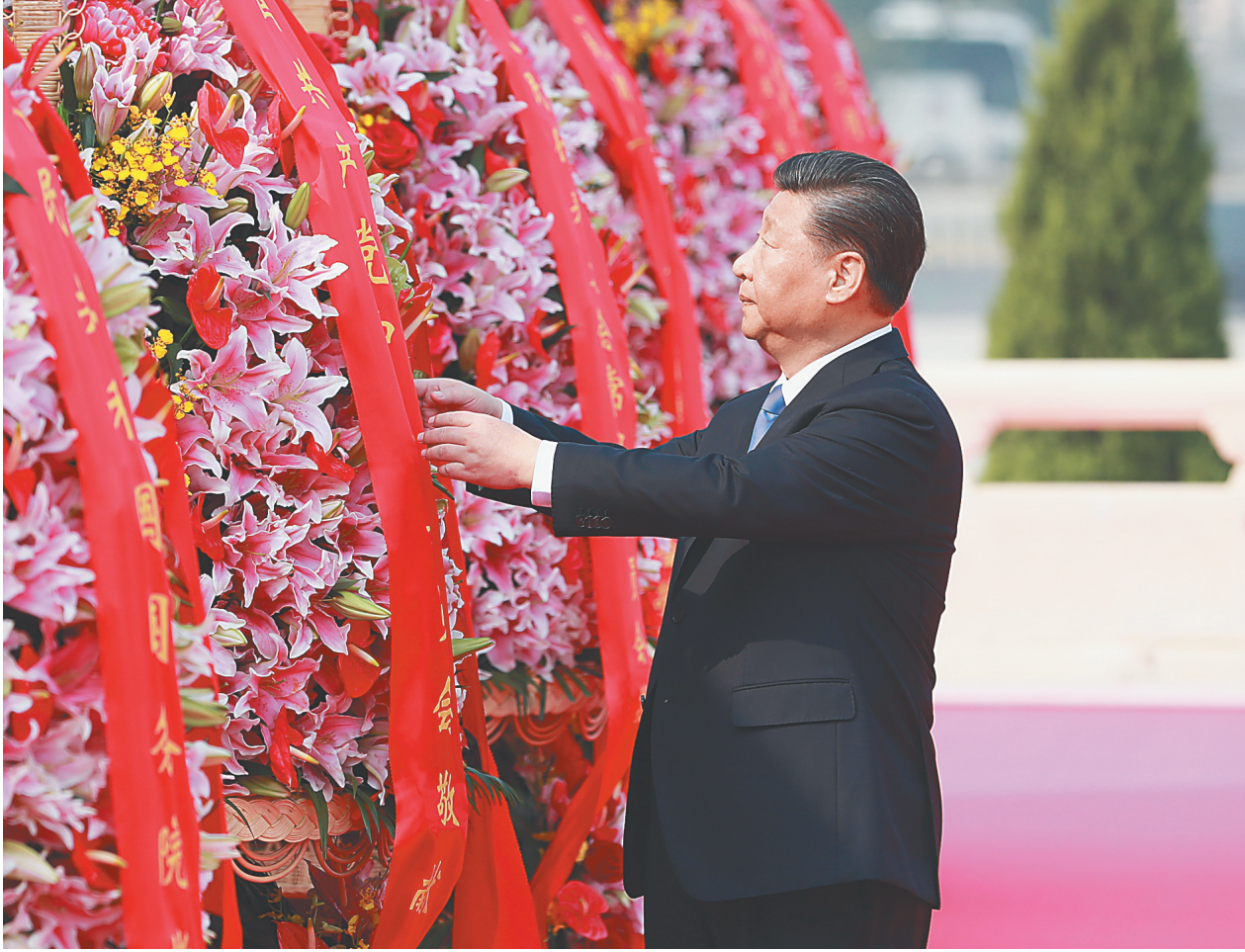
9月30日上午，习近平、李克强、栗战书、汪洋、王沪宁、赵乐际、韩正、王岐山等党和国家领导人来到北京天安门广场，出席烈士纪念日向人民英雄敬献花篮仪式。图为习近平整理花篮上的缎带。