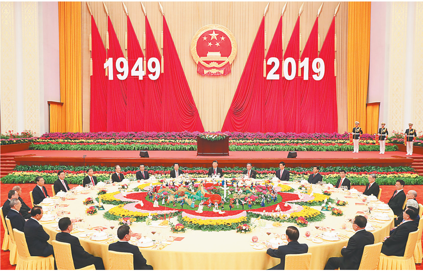
9月30日晚，庆祝中华人民共和国成立70周年招待会在北京人民大会堂隆重举行。习近平、李克强、栗战书、汪洋、王沪宁、赵乐际、韩正、王岐山等党和国家领导人与4000余名中外人士欢聚一堂，共庆新中国70华诞。

新华社北京9月30日电（记者杨维汉 罗争光）庆祝中华人民共和国成立70周年招待会30日晚在人民大会堂隆重举行。中共中央总书记、国家主席、中央军委主席习近平出席招待会并发表重要讲话。他强调，在新的征程上，我们要高举团结的旗帜，紧密团结在党中央周围，巩固全国各族人民的大团结，加强海