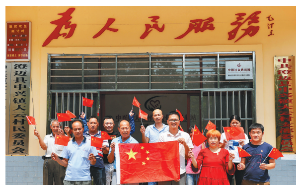
9月30日，在澄迈县中兴镇大云村委会，乡村振兴工作队队员与村民一起和国旗合影，共同祝福伟大祖国。