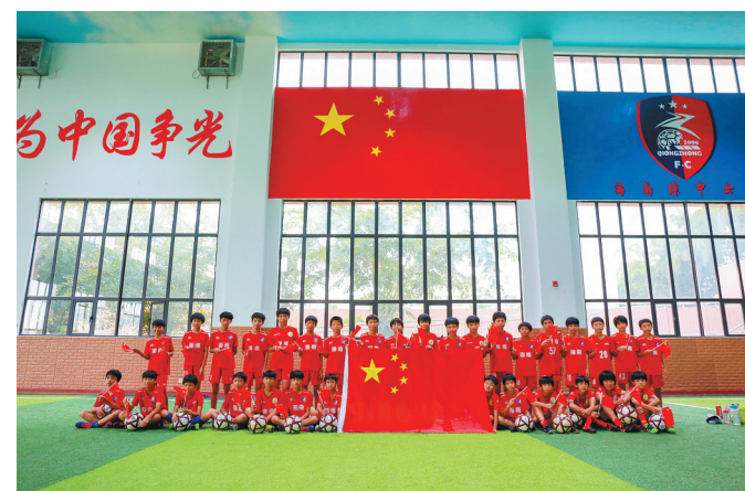
9月27日，在琼中黎族苗族自治县琼中女足管理中心，女足队员和国旗合影。