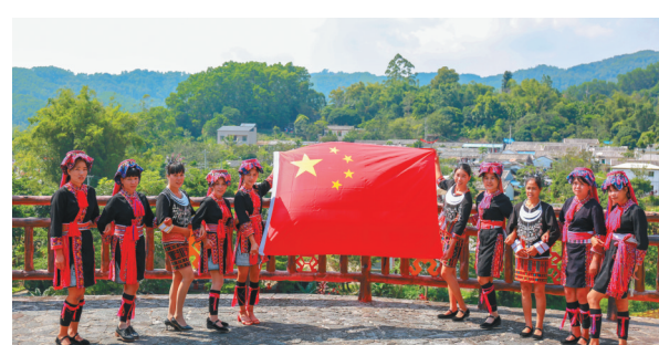
9月27日，琼中黎族苗族自治县什寒村的少数民族群众在村里与国旗合影，为新中国成立70周年送上祝福。