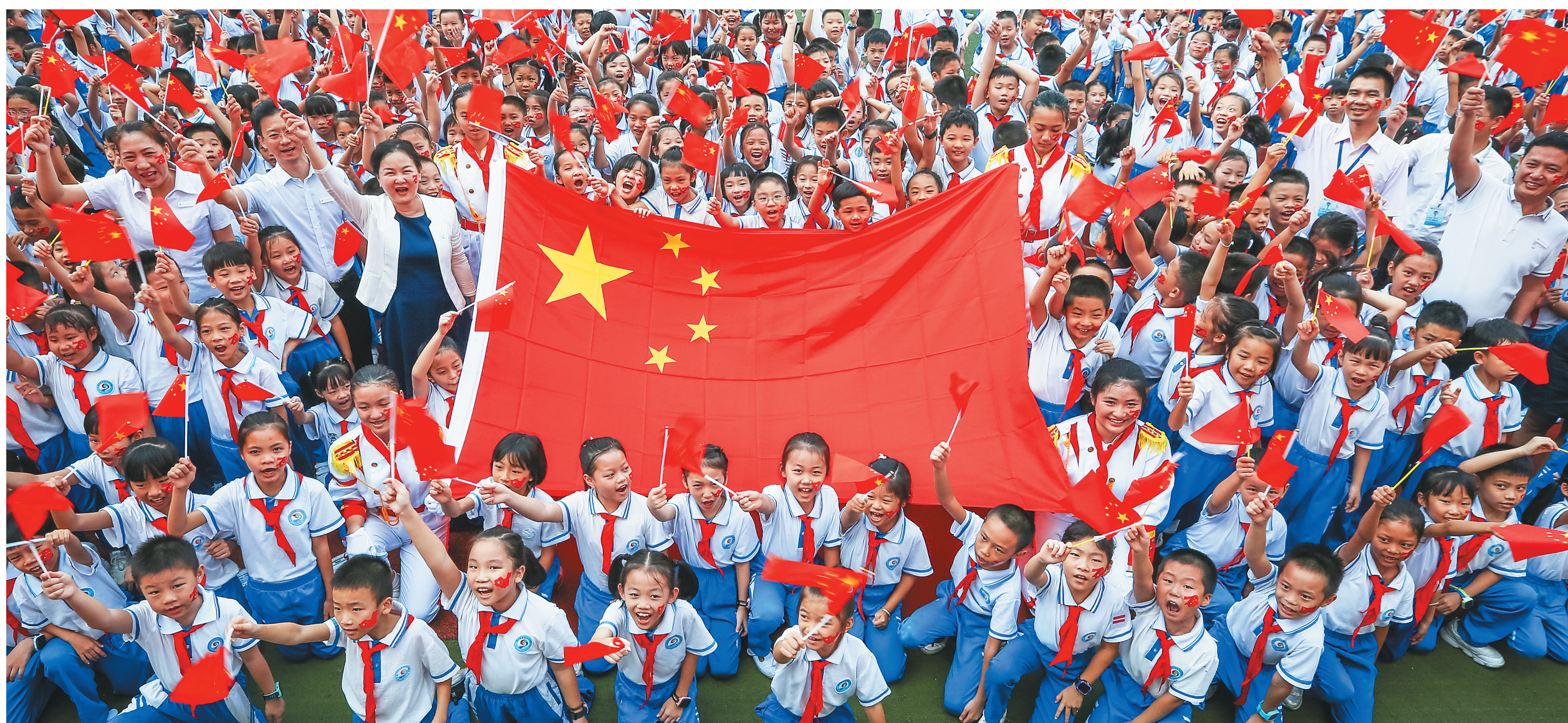
9月30日，海口市滨海第九小学3000多名师生挥舞国旗同唱《我和我的祖国》，为祖国送祝福。