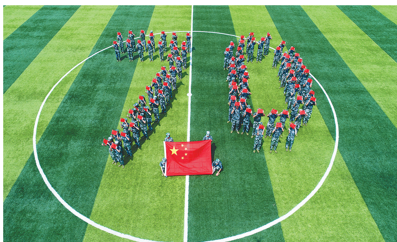
9月26日，万宁中学刚入校的新生在操场摆出“70”的图案，祝福祖国繁荣昌盛。