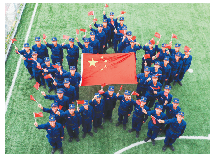
9月29日，为庆祝新中国成立70周年，三亚市消防救援支队与国旗同框，表达爱国之情。