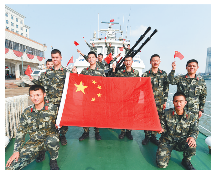
9月27日，海南海警局组织开展“我和我的祖国”国庆专题党团活动，海警人员与国旗合影，庆祝新中国成立70周年。