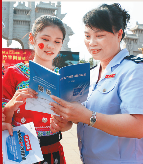
税务干部向纳税人介绍海南省电子税务局。