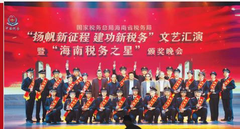
通过文艺汇演等多种形式,促进税务干部的融合。

历史车轮滚滚向前,世事沧桑瞬息万变,新中国成立70年来,税收工作随着改革开放的逐步深入而不断前行。从财税分家、国地税分设,再到国地税征管体制改革,一代代海南税务人不忘初心,砥砺前行,从“粗放型”管理到“精细化”管理,从“双腿走路”到“数据跑路”,变化的是日新月异的办税方式,但不变的,是始终以服务纳税人为根本,以减税降费惠民为遵循,以促进经济发展为主线,打造越来越便捷、高效的税收管理新格局。多年来,海南税务人以红色娘子军精神为动力铸造税魂,用忠诚、担当、奉献在琼州大地上写下了“为国聚财,为民收税”的壮丽新篇。