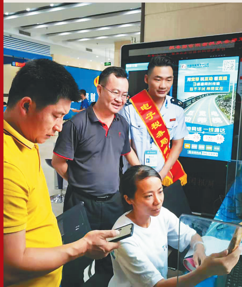
纳税人体验电子税务局带来的便利。