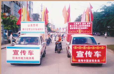
《中华人民共和国税收征收管理法实施细则》出台后,琼海市国、地税联合开展税收宣传。