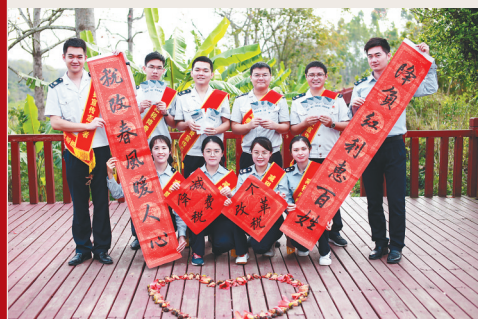
税务干部宣传减税降费政策。