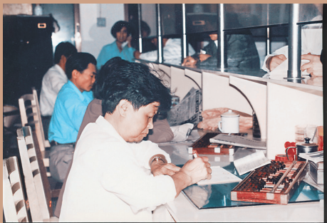
上世纪90年代,一把算盘一本票是税收工作的重要工具。