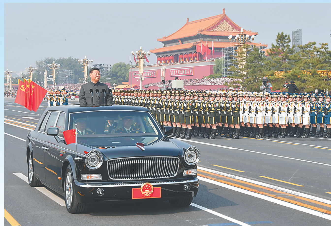
10月1日，庆祝中华人民共和国成立70周年大会在北京天安门广场隆重举行。这是中共中央总书记、国家主席、中央军委主席习近平检阅受阅部队。