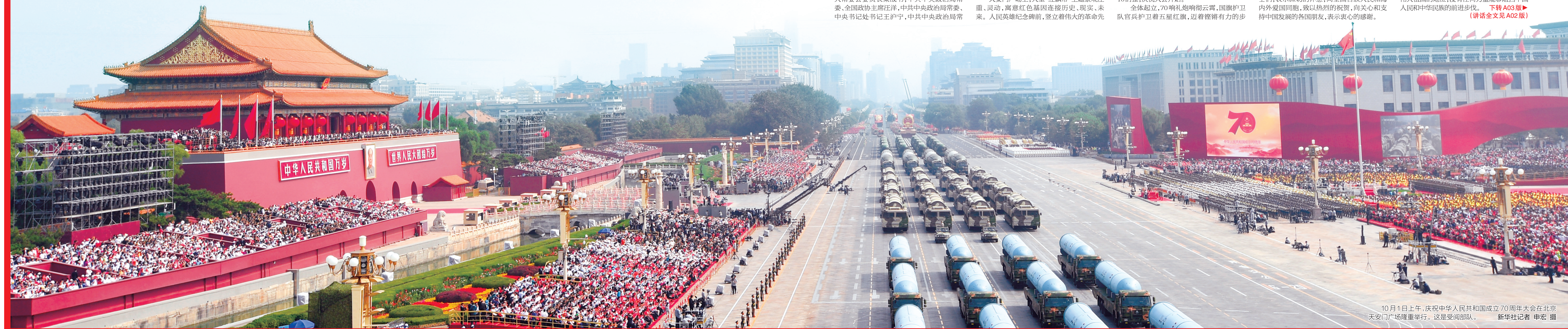
10月1日上午，庆祝中华人民共和国成立70周年大会在北京天安门广场隆重举行。这是受阅部队。

持中国发展的各国朋友，表示衷心的感谢。 习近平在讲话中指出，70年前的今天，毛泽东同志在这里向世界庄严宣告了中华人民共和国的成立，中国人民从此站起来了。这一伟大事件，彻底改变了近代以后100多年中国积贫积弱、受人欺凌的悲惨命运，中华民族走上了实现伟大复兴的壮阔道路。70年来，全国各族人民同心同德、艰苦奋斗，取得了令世界刮目相看的伟大成就。今天，社会主义中国巍然屹立在世界东方，没有任何力量能够撼动我们伟大祖国的地位，没有任何力量能够阻挡中国人民和中华民族的前进步伐。 下转 A03 版 (讲话全文见 A02 版)