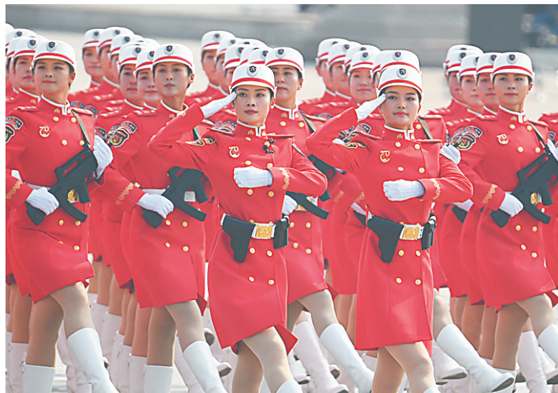
10月1日上午，庆祝中华人民共和国成立70周年大会在北京天安门广场隆重举行。这是民兵方队。