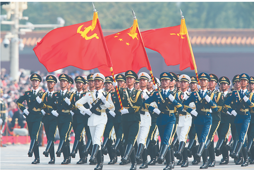
10月1日上午，庆祝中华人民共和国成立70周年大会在北京天安门广场隆重举行。这是行进中的仪仗方队。