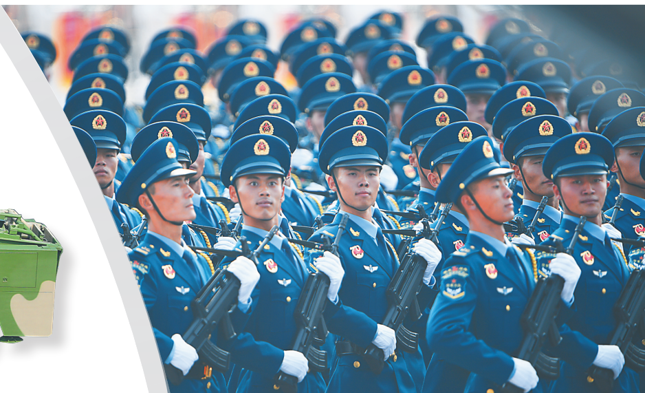
10月1日上午，庆祝中华人民共和国成立70周年大会在北京天安门广场隆重举行。这是空军方队。