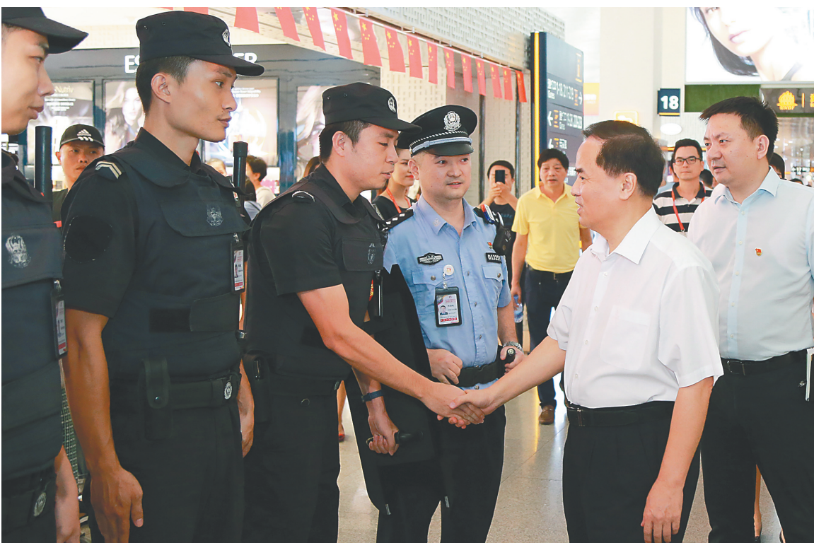
10月3日，省委书记刘赐贵来到海口美兰国际机场调研，看望慰问国庆期间坚守岗位的工作人员等。本报记者 李英挺 摄

省委常委、常务副省长毛超峰，省委常委、秘书长胡光辉，副省长符彩香、沈丹阳参加活动。