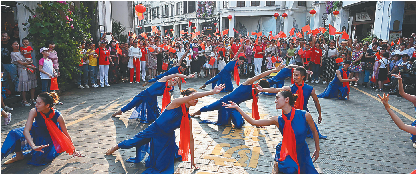
十月一日，海口骑楼老街举办的文艺节目吸引了众多市民游客。本报记者 王凯 摄

推动文化消费离不开文化元素特别是地方文化元素的深度挖掘。文化是旅游的靈魂，只要在这上面做足文章，推出令人耳目一新和值得回味的“文化大餐”，注定会赢得市场的青睐。