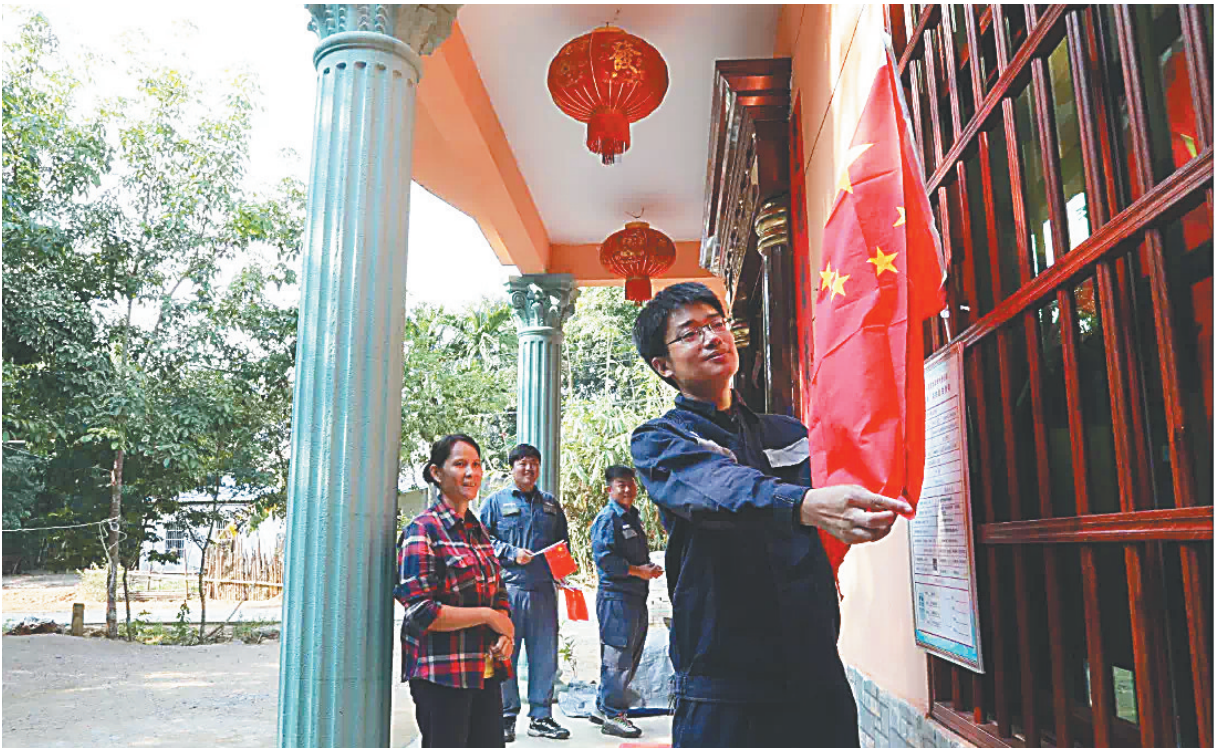
10月3日，白沙南达村，乡村振兴工作队队员给村民们的新居插上国旗庆国庆。

本场爱心扶贫大集市上，摆满了各种特色农产品，有绿壳鸡蛋、大茂酸菜、蜂蜜、羊肉、牛肉、散养鸡以及当地的瓜果蔬菜。