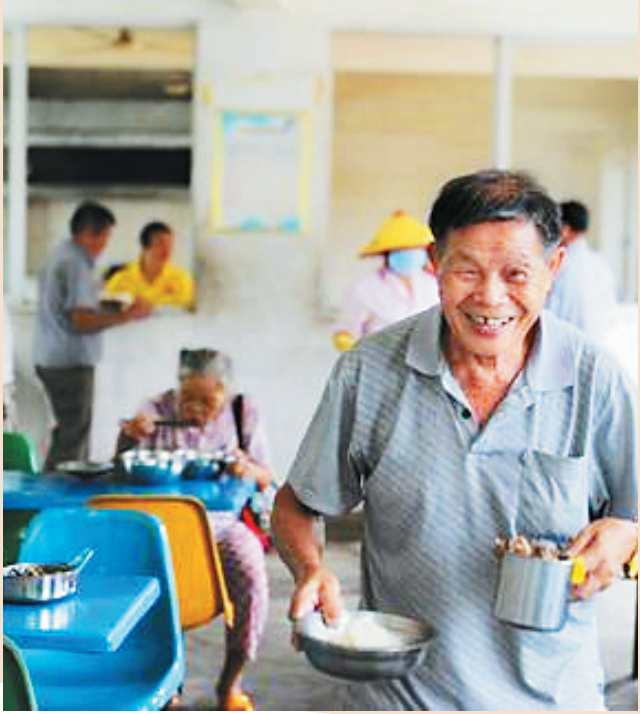
海口市遵谭镇敬老院,老人在食堂就餐。