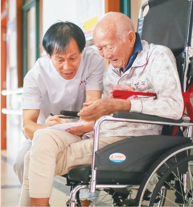
在省托老院,老人在享受护工的服务。