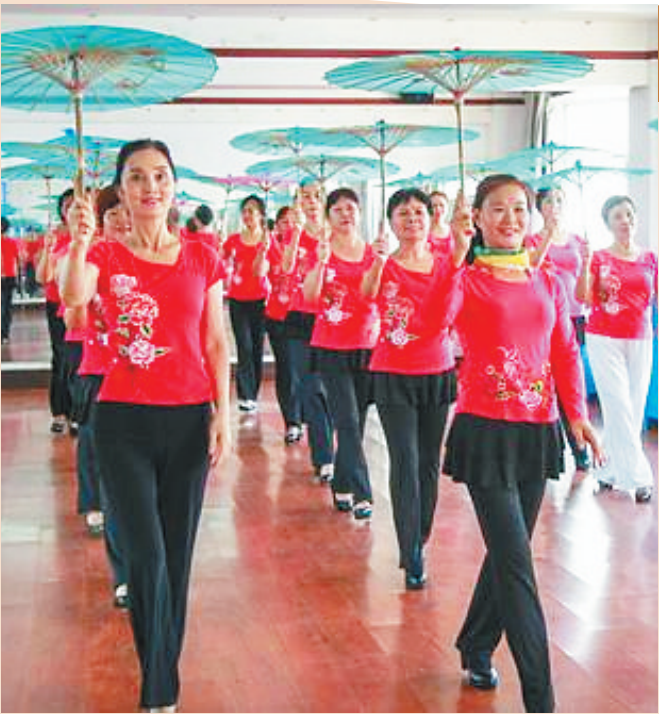
海口市美兰区文联路,老年人在一起排练舞蹈。