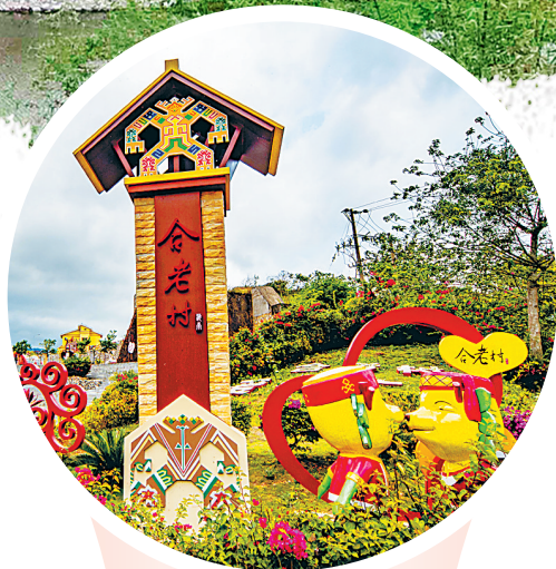
展乡村旅游业,进行旅游化改造,琼中红毛镇合老村。

会办公室,同时增设党务信息、旅游信息等多方面咨询服务,打造出一批“党员驿站”党建服务品牌。 基层党组织有了“前哨堡垒”,很快释放出服务一线的“红色”活力。 “我们推行‘县领导驻点、乡镇包片、部门包村、干部包户’四级联动帮扶,选派了多批干部深入基层开展‘联心富民’‘四联三问’‘联村帮扶’‘第一书记’培养等工作,实现结对帮扶全覆盖。”在琼中县委副书记、组织部长、政法委书记栗太强看来,一分部署后的九分落实,靠的是基层党员干部的凝聚力、战斗力,而基层党建责任网的编织,正不断延伸基层党组织的服务触手,推动全面从严治党主体责任落地生根。