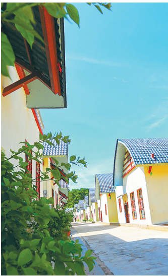
琼中营根镇朝参村得益于村庄推进政策,村庄变得越来越漂亮。

从群众的操心事、烦心事、揪心事入手,近年来琼中通过实施“联心富民”工程,全面打造“党员驿站”党建服务品牌,建设网格化村级便民服务站,让党组织和党员干部在精准帮扶、发展产业、连心服务中唱主角、当先锋,有效实现基层党建与乡村振兴互融互促、同频共振。