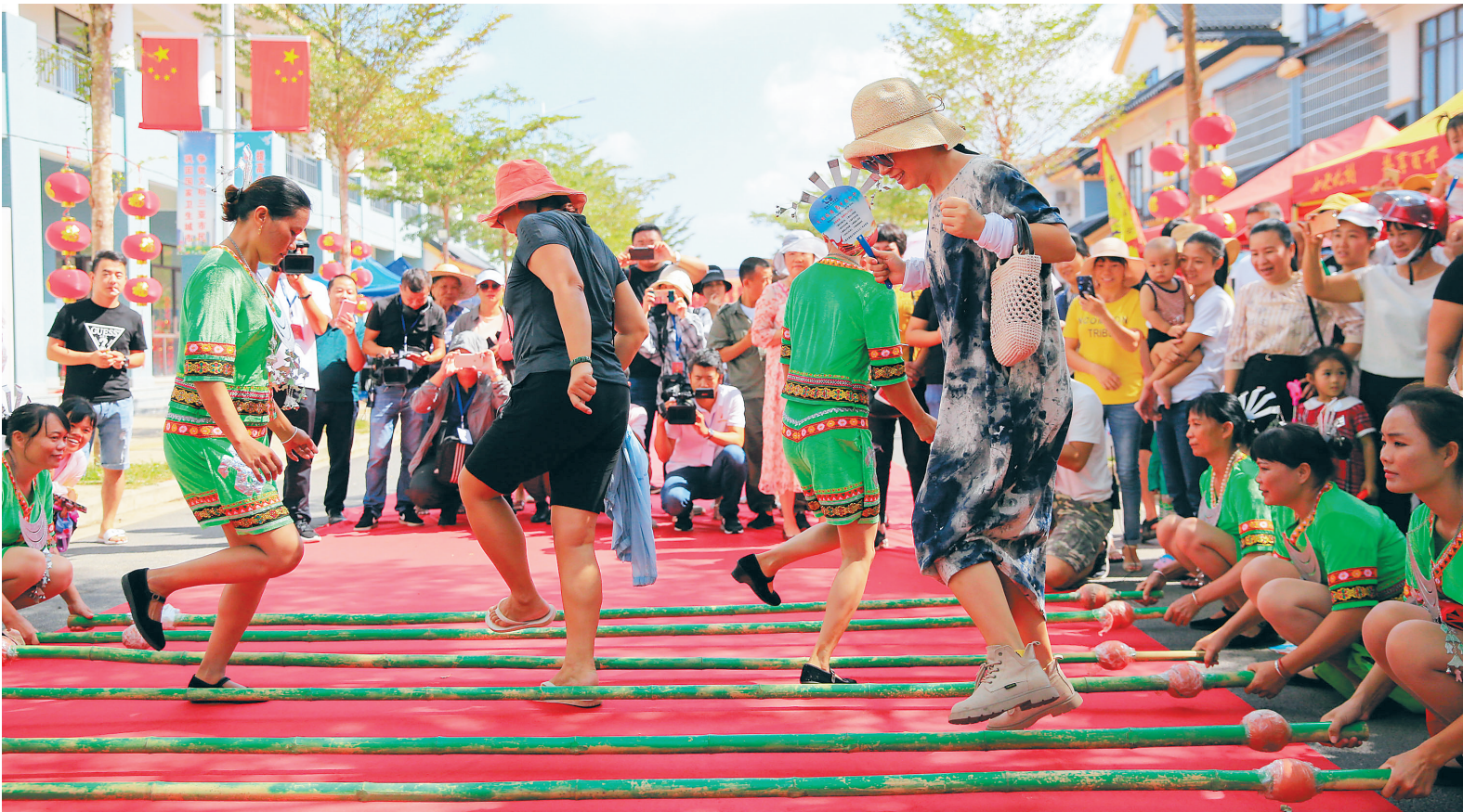
10月12日，2019年三亚海棠湾庙会在龙海风情小镇举行，吸引不少市民游客游览体验。