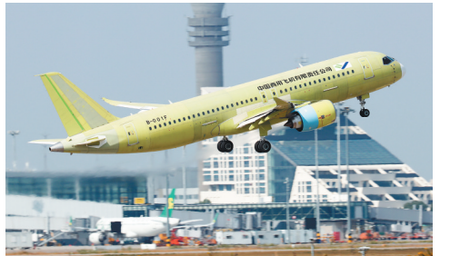
10月24日，C919大型客机105架机在上海浦东国际机场起飞。

新华社上海10月24日电（记者贾远琨）10月24日，C919大型客机105架机于10时整从上海浦东国际机场起飞，经过1小时37分钟的飞行，在完成了多个试验点、对飞机各系统进行了初始操纵检查后，于11时37分返航并平稳降落，顺利完成其首次试验飞行任务。105架机是C919大型客机第5架试飞飞机，主要承担高温、高寒等特殊气象条件，以及环控、电源、全机排液等相关科目的试飞任务。截至目前，中国商飞公司共有5架C919飞机投入试飞工作。