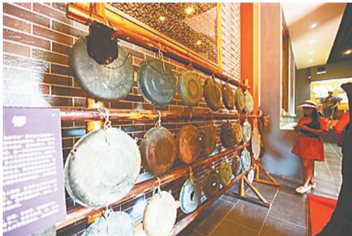
白沙河谷的展品。