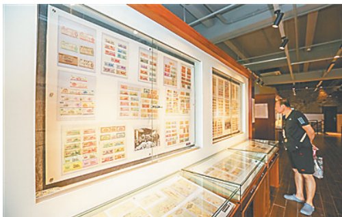
游客在铭德票证博物馆参观。