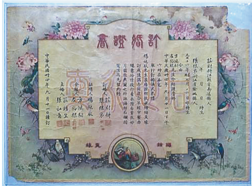
铭德票证博物馆收藏的民国结婚证。

早晨的阳光倾泻而下，笼罩着海口中山路，光影下的屋檐廊道显露出岁月的痕迹。海口骑楼老街是中国历史文化名街之一，也是海南名副其实的“网红打卡地”，每位来骑楼老街的游客都会有不一样的收获，也许是听到街角咖啡馆传出一段悦耳的钢琴曲，也许是在中山路60号的票证博物馆里，用老票证打开通向过往的窗户，得以窥见往日的时光。