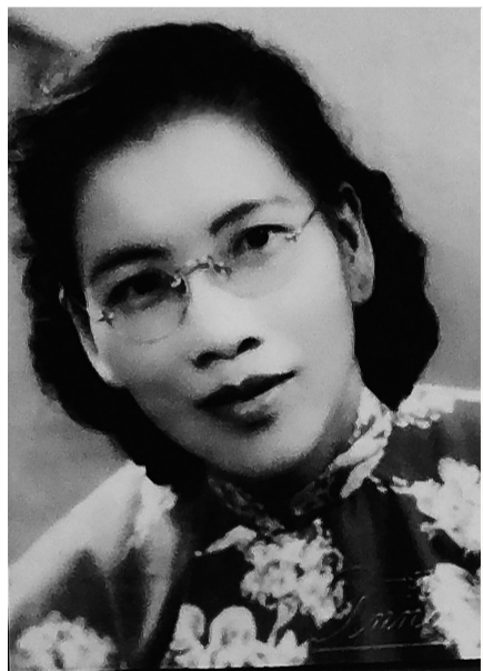
南侨机工传奇女英雄白雪娇。

种种艰险, 重重难关。在这等恶劣的环境下, 从1939年3月至1942年5月, 南侨机工们运送了10万中国远征军入缅作战, 抢运了约50万吨军火、15000余辆汽车。 [图]