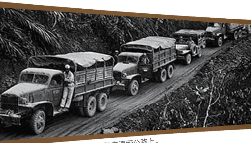
南侨机工运输抗战物资的军车行驶在滇缅公路上。