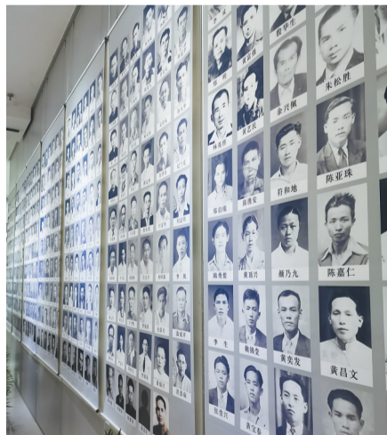
南侨机工英雄群像。