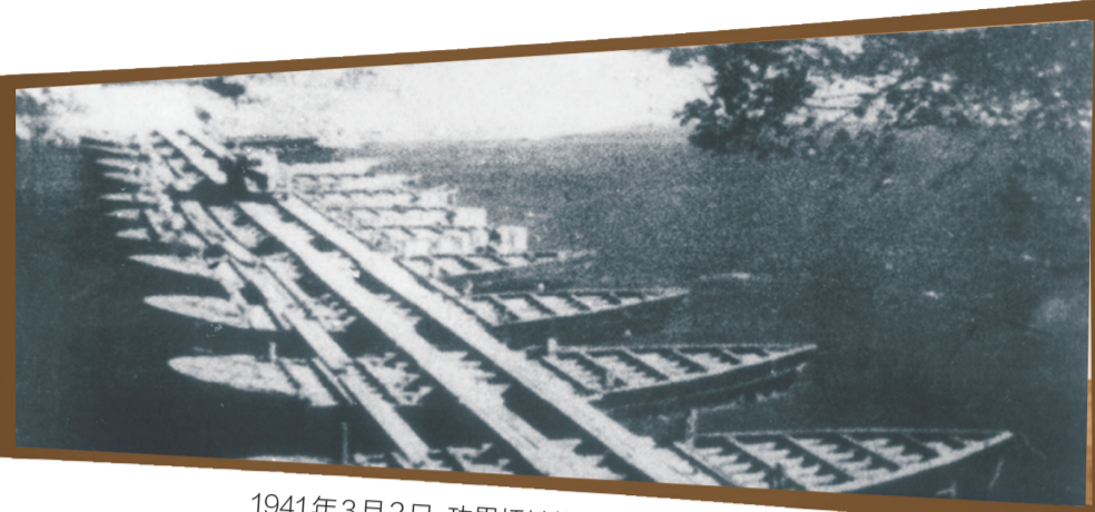
1941年3月2日, 功果桥被炸后, 南侨机工用渡船连成浮桥, 运送军用物资。