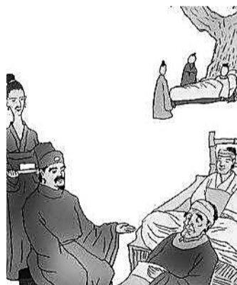
隋朝循吏辛公义爱民如子。（资料图片）