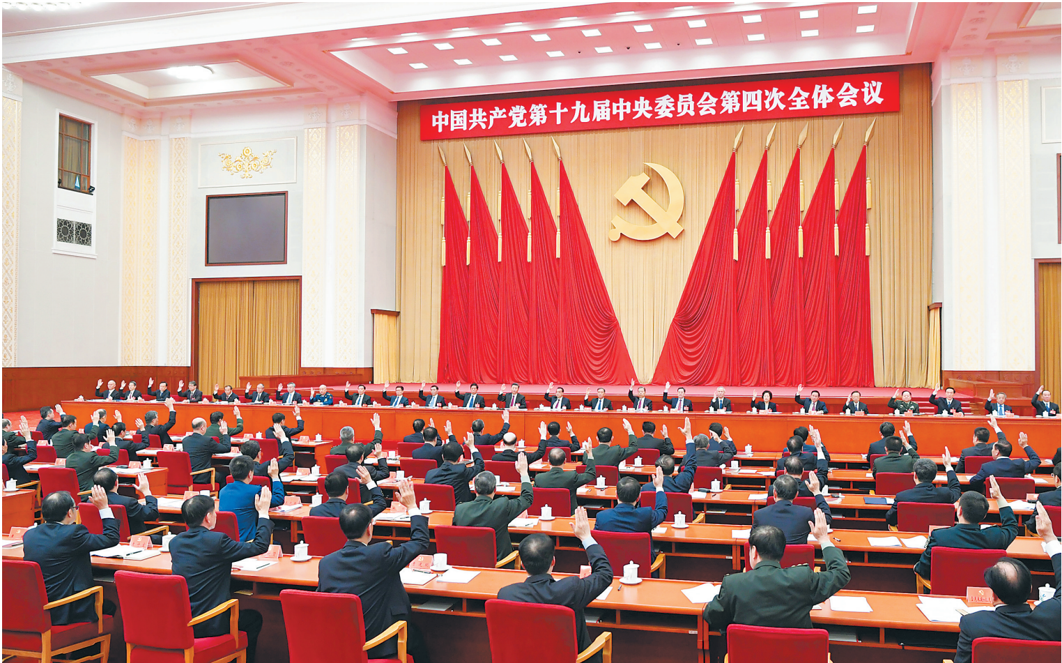
中国共产党第十九届中央委员会第四次全体会议,于2019年10月28日至31日在北京举行。中央政治局主持会议。