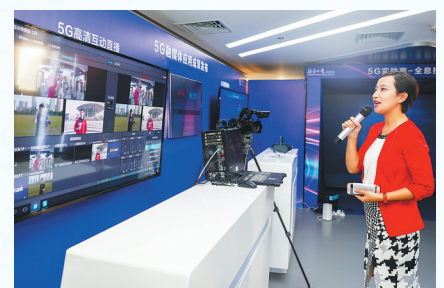
南海网主持人与前方记者正在进行5G高清互动直播。