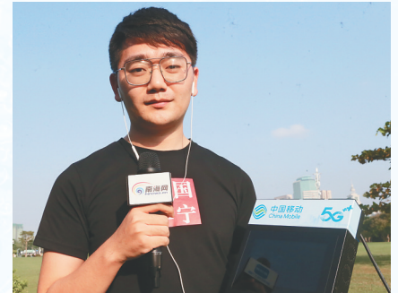
南海网记者正在进行5G高清互动直播，搭载中国移动最新研发的“和背包”，将背包采集的视频即时高速回传。