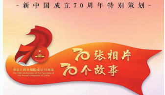
新中国成立70周年特别策划：《70张照片 70个故事》