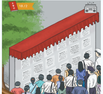
H5作品《快来！搭乘“海南号”时空穿梭机重返1988！》