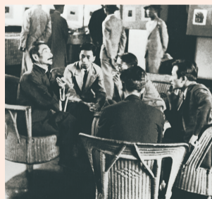
1936年,逝世前11天的鲁迅。