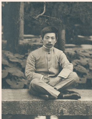
在日本留学时的鲁迅。