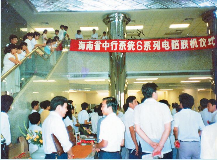
1988年6月,海口分行率先开发S系统电脑综合处理系统,成为全国第一家储蓄业务全省通存通兑的银行。