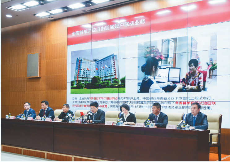
2019年4月11日,海南中行创新“全国首单沪琼FT账户联动业务”入选海南自贸区制度创新案例。