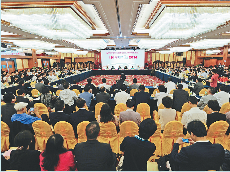
2014年11月,海南中行举办庆祝成立100周年座谈会。