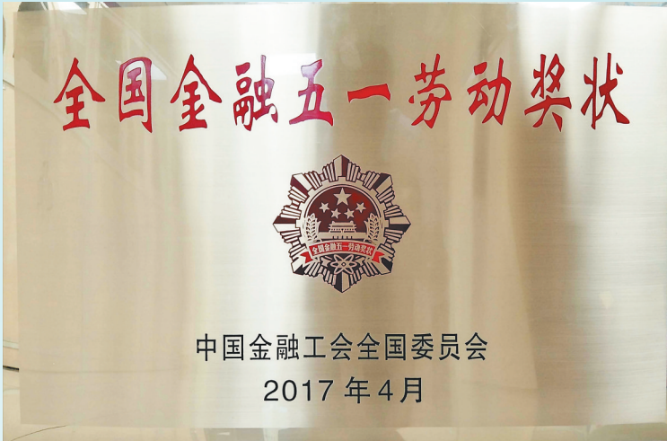
2017年4月,海南中行荣获2017年“全国金融五一劳动奖状”。