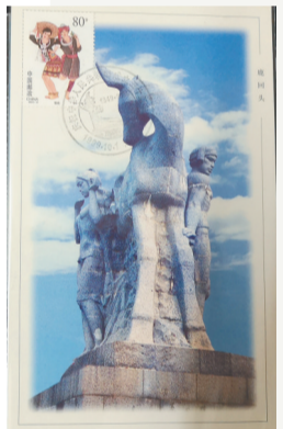
一张以林毓豪创作的鹿回头石雕为背景制成的极限明信片。