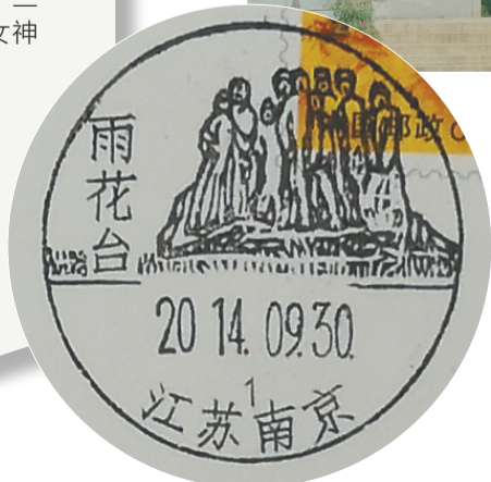
林毓豪 1977 年创作的南京雨花台纪念碑是他的成名作，南京市邮票公司的雨花台风景邮戳正是据此设计制作的。