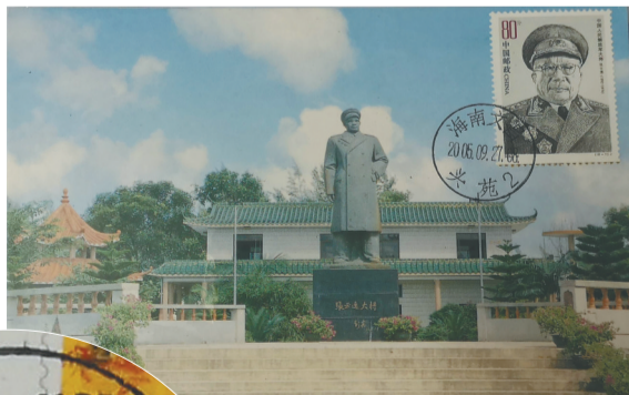
海南省邮电管理局 1996 年发行的张云逸大将邮票，取材于林毓豪创作的张云逸铜像。