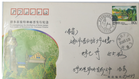
2004 年 5 月 5 日，我国发行侨乡新貌邮票，其中一枚为兴隆华侨农场。同日，海南省邮资票品局发行纪念封一种，启用纪念戳一种，其图案是以林毓豪的创业者石雕为原型设计的。

虽然林毓豪先生离开我们 20 余年了，但他创作的雕塑作品永远活在时间之外，永远活在人们的心里，他创作的源泉——家乡海南岛的人文形象，也随着其雕塑作品及其相关邮品，得以传播到神州大地。