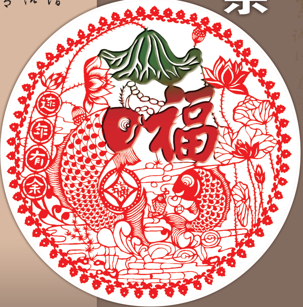
天津大郑剪纸 中宣部宣教局 中国网络电视台