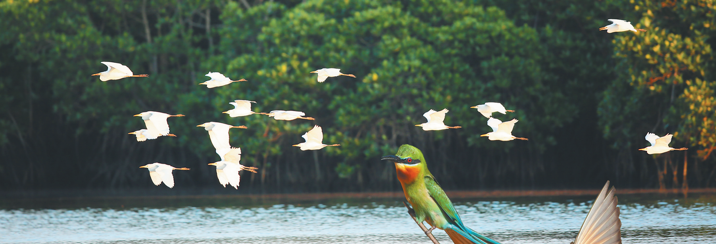
一群白鹤鹑掠过琼北的红树林。

反之,如果雄鹭对雌鹭没有感觉的话,就会机警地伸展冠羽、蓑羽和胸羽进行威吓,雌鹭只能离开,等待与下一个雄鹭相遇。黄嘴白鹭是罕见冬候鸟,见于沿海的河口和泥滩,对栖息地的环境要求很高,1980年代后大量的水鸟栖息地不断丧失,使得黄嘴白鹭变成了易危的珍稀水禽。它们是和朱鹮、琵鹭同属一支的表亲,系鹳形目的鹭科鸟类,是国家二级保护动物,近年在临高新盈、海口东寨港、乐东莺歌海有单个纪录。