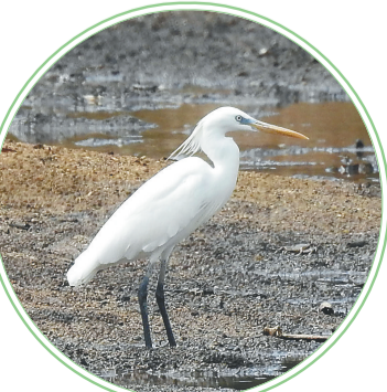
黄嘴白鹭。

它是国家二级保护动物、IUCN易危物种,罕见过境鸟,全球数量不足一万只,由于森林砍伐和人为干扰造成的栖息地破碎化,正在不断威胁着这种美丽的小鸟。