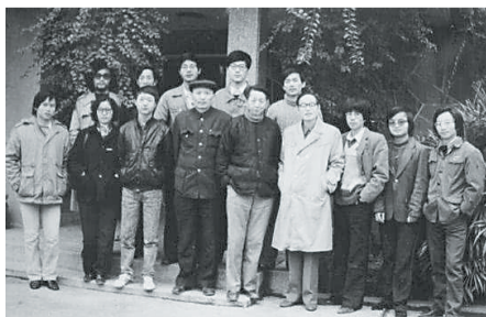
1987年11月访问新诗研究所(中为流沙河,右四为吕进)。

流沙河(1931年11月11日—2019年11月23日)，中国现代诗人、作家、学者、书法家。1931年出生于四川金堂，本名余勋坦。主要作品有《流沙河诗集》《故园别》《游踪》《台湾诗人十二家》《隔海谈诗》《台湾中年诗人十二家》《流沙河诗话》《锯齿啮痕录》《庄子现代版》《流沙河随笔》《Y先生语录》《流沙河短文》《流沙河近作》等。诗作《就是那一只蟋蟀》《理想》被中学语文课本收录。