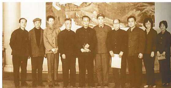
第一届全国文学奖获得者合影(左三为流沙河)。