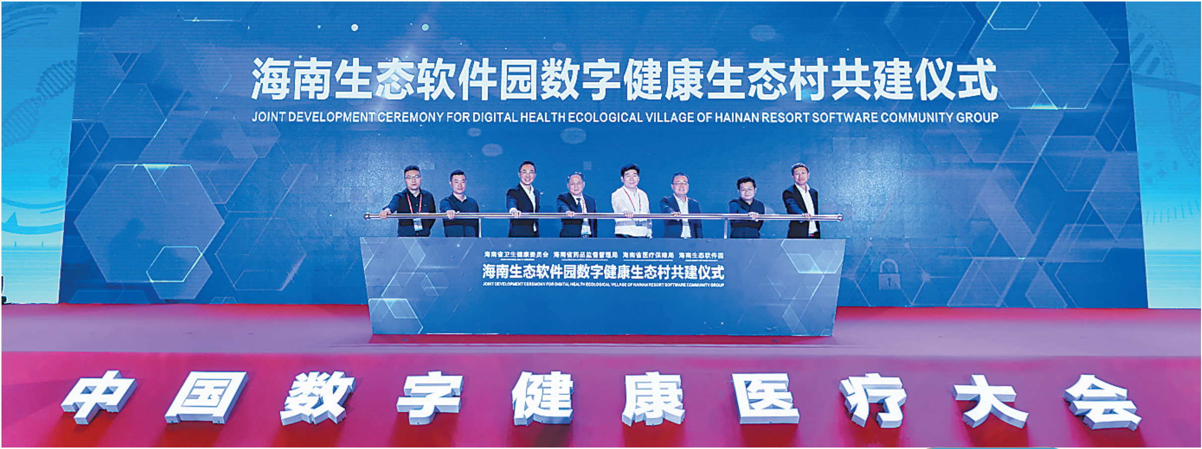
在中国数字健康医疗大会上，全国首个“数字健康生态村”发布。