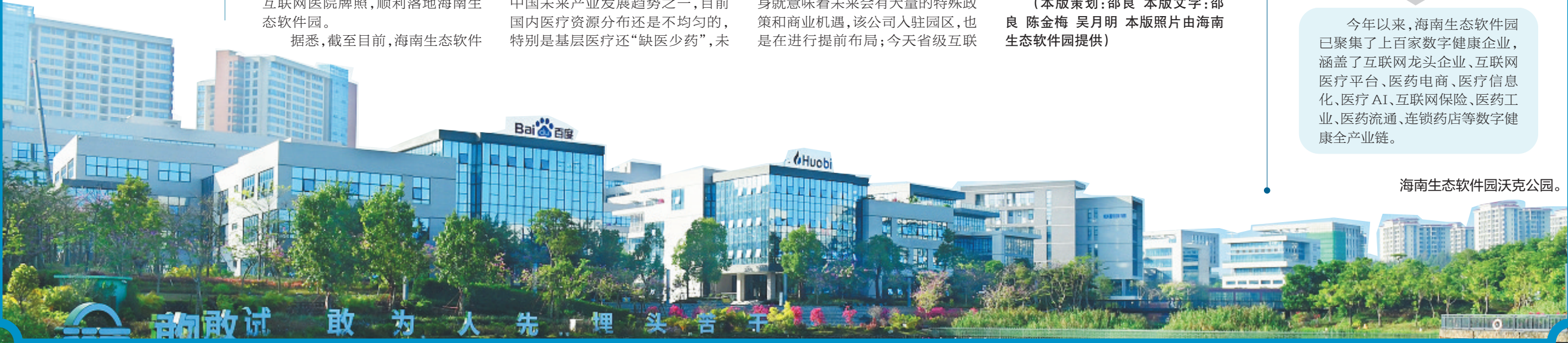
海南生态软件园沃克公园。

今年以来，海南生态软件园已聚集了上百家数字健康企业，涵盖了互联网龙头企业、互联网医疗平台、医药电商、医疗信息化、医疗AI、互联网保险、医药工业、医药流通、连锁药店等数字健康全产业链。