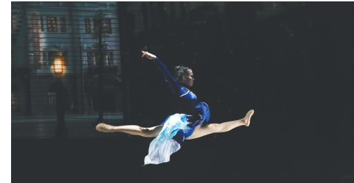
嘉积中学海桂学校舞蹈团专场《舞动芳华》。

琼海市教育相关负责人表示,将借助首届校园舞蹈节的举办,打造展示琼海当代学生昂扬的精神风貌,引领健康的校园文化,提升学生综合素养的平台,在全市营造格调高雅、富有美感、充满朝气的校园文化环境,提高学校美育以育人、以文化人的社会影响力。