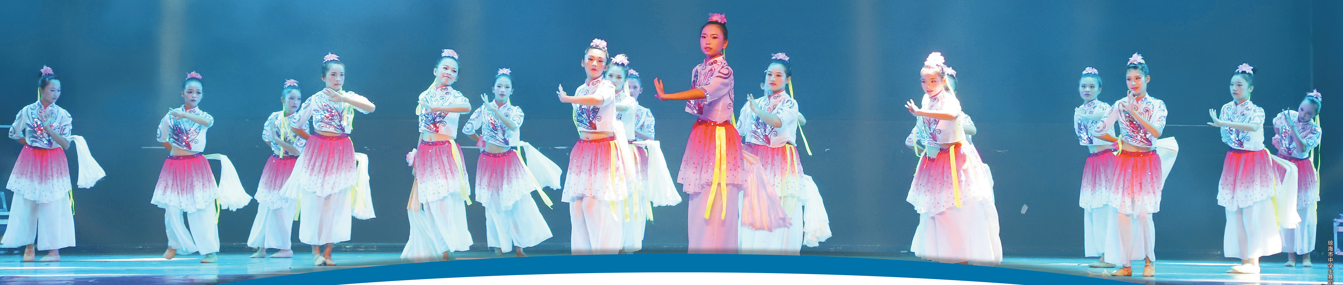
琼海市中学生舞蹈展演演出。