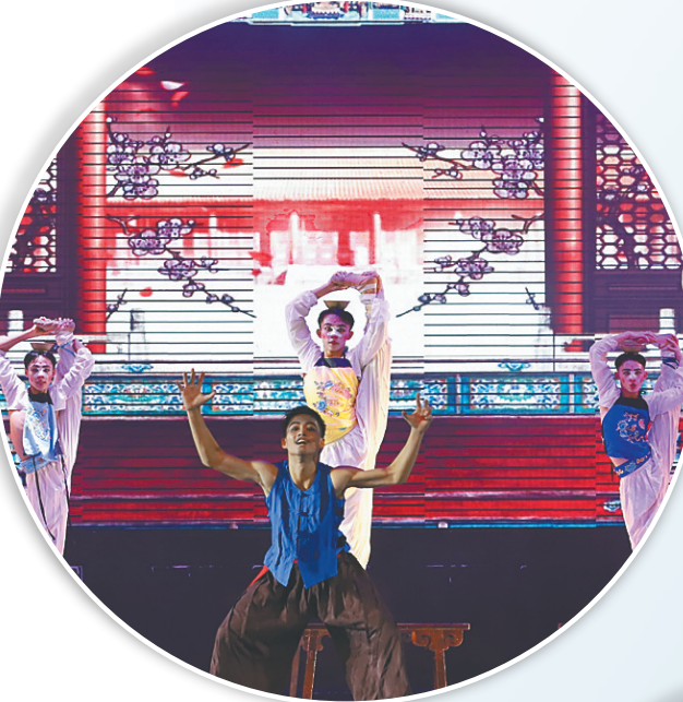
嘉积中学男子舞蹈团初中教学剧目汇报专场。