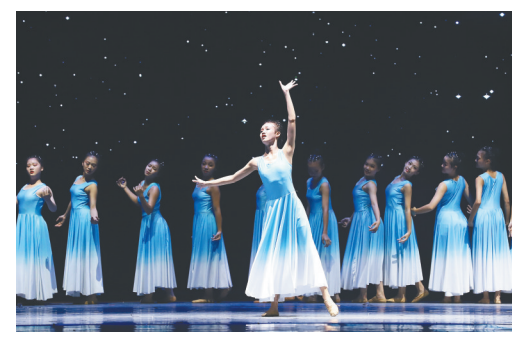
嘉积中学女子舞蹈团专场《舞动青春》。

11月21日晚,琼海市首届校园舞蹈节在嘉积镇举办开幕式晚会。这场晚会,来了位特殊的嘉宾,他就是张继钢。