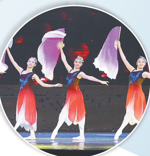
嘉积中学海桂学校舞蹈团专场《舞动芳华》。