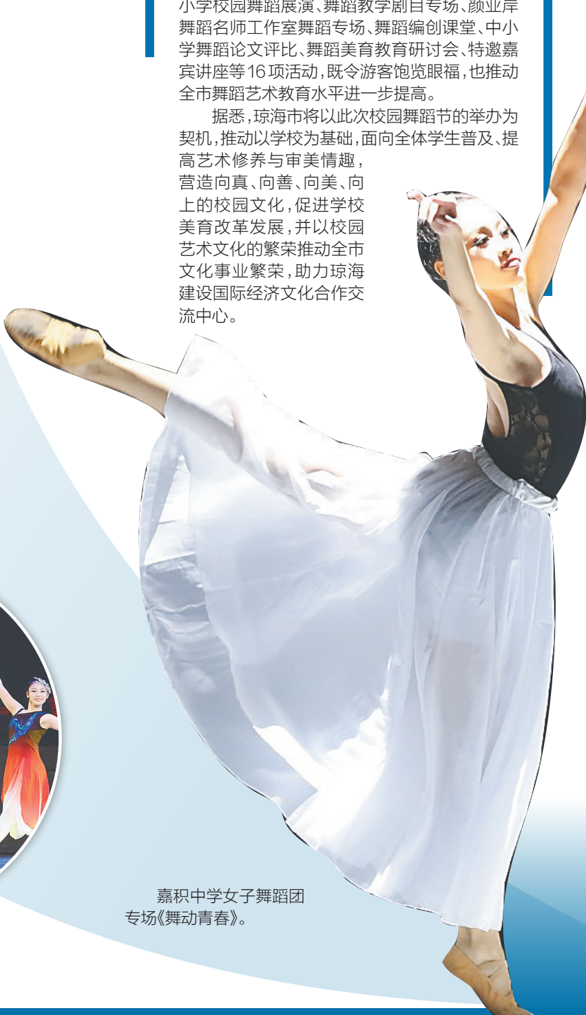
嘉积中学女子舞蹈团专场《舞动青春》。