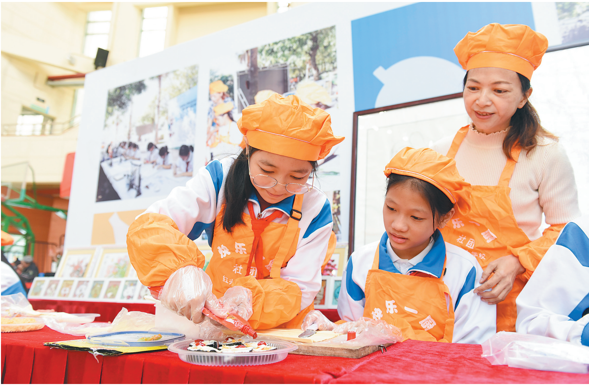
12月3日,澄迈县全民终身学习活动周举行,“候鸟”教师(右)教小朋友做寿司。