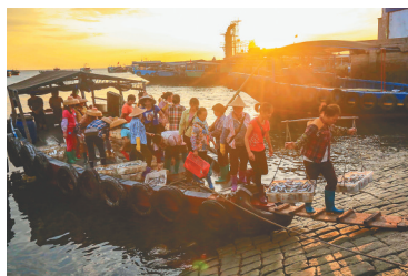
儋州市白马井中心渔港鱼市。

海南渔谚，反映了古代渔民独特的生产生活方式及精神价值，随着科技的快速发展、老渔民的减少，也使渔谚传承面临困难。记录、宣传这些渔谚，也是对旧时渔民生产生活的一段历史和一种文化的铭记。