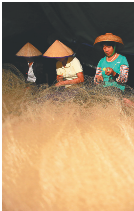
临高渔民在整理渔网。