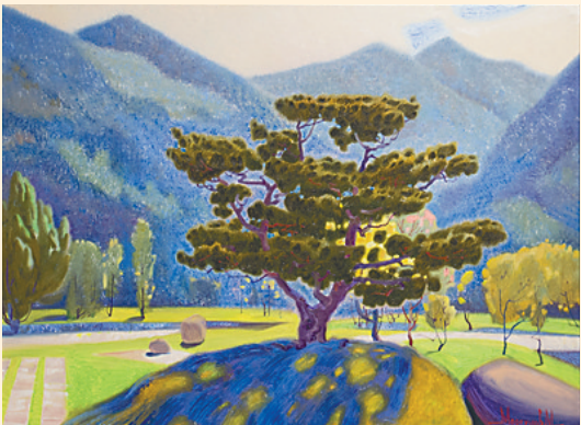
莫尔古诺夫作品《松树》。