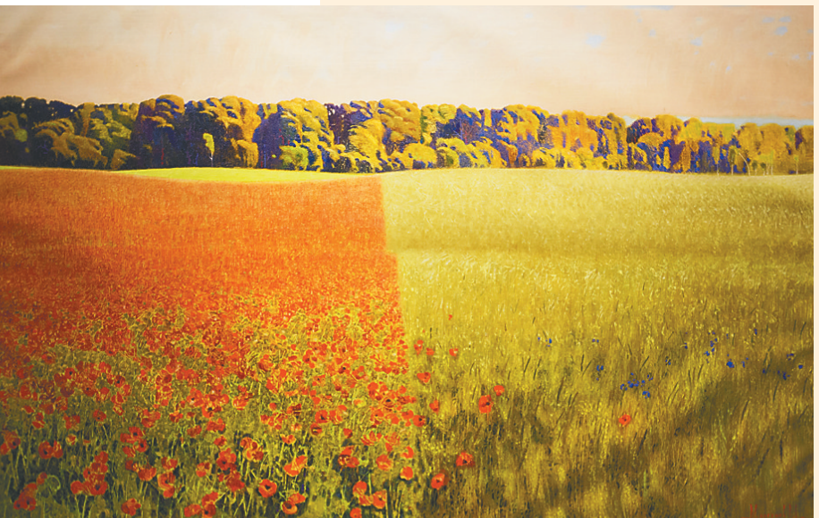
莫尔古诺夫作品《罂粟与黑麦》。

12月10日，俄罗斯国立列宾美术学院（以下简称列宾美院）油画展在三亚湾红树林度假世界今日艺术汇启幕，画展免费向公众开放至12月15日。作为2019年俄罗斯文化周的一项重要活动，此次油画展让三亚的市民游客通过30幅风景油画精品欣赏到俄罗斯风景与艺术之美。