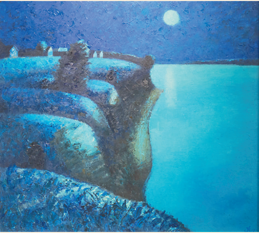
秋文作品《伏尔加河的月夜》。