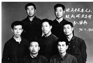
延安大学时期的路遥(后排左1)与同学们合影。

《平凡的世界》刚开始时并不被看好,先是被一家著名文学刊物退稿,后又被北京一家出版社拒绝。即使第一部出版后,评论界评价也不高。之所以出现这种局面,是因为当时先锋派、意识流、魔幻现实主义、现实主义等新潮文学流派已经进入中国,并应用于文学创作当中。有人认为,与这些文学流派相比,路遥的现实主义手法已经过时、老套,似乎还停留在“十七年”文学时期。但路遥顶住压力,坚持了自己的写法,至1988年春节,终于完成了第三部的初稿,这部风格整体一致的长篇巨著完整呈现在读者面前。1991年3月,《平凡的世界》获得第三届茅盾文学奖,路遥得到文学界和读者的认可。