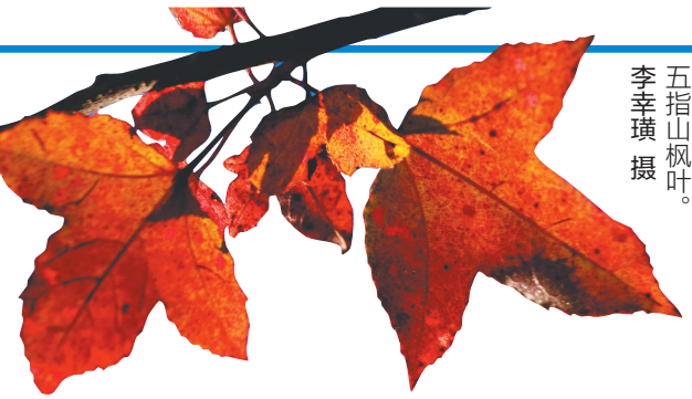
五指山枫叶。

《编者按》 『北风往复几寒凉，疏木摇空半绿黄。』 如同诗里写的那样， 多数人刻板印象里的冬天总会显得有些苍凉。 北风呼啸一路向南， 越过山川与海峡后气势渐弱， 才发现终究还是抵不过那满目精致的盎然生机。 蓝天白云，碧波翻涌， 葱郁乡野间簇簇黄花红叶兀自绽放…… 从沿海到腹地色彩层次分明， 有着独一无二的新鲜与璀璨。 你会因为哪种颜色， 爱上海南呢？