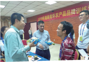
创业青年在品牌打造训练营上交流

一直以来，省委省政府高度重视青年创新创业工作，团省委不断深化青年农村创业工作，通过创新机制、搭建平台、树立典型、打造品牌等方式方法，整合政府、企业、投融资机构、行业协会等各方资源帮助有志青年扎根农村创新创业，让一批热爱农村、愿意扎根农村、有能力带领农村发展振兴的优秀青年在实现自我价值的同时，为助力乡村振兴和加快海南自贸区、自贸港建设贡献青春力量。