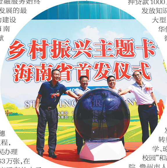
二〇一九年八月十四日，海南农行联合中国银联海南分公司举办乡村振兴主题卡海南首发仪式。

近3年，海南农行累计发放精准扶贫贷款近90亿元，带动服务贫困人口5.28万人，精准扶贫贷款市场份额第一，每年均超额完成省政府下达的扶贫任务。海南农行在全省金融系统打赢脱贫攻坚战暨先进表彰大会中收获多项殊荣，是5家获得表彰单位中唯一一家专业银行。