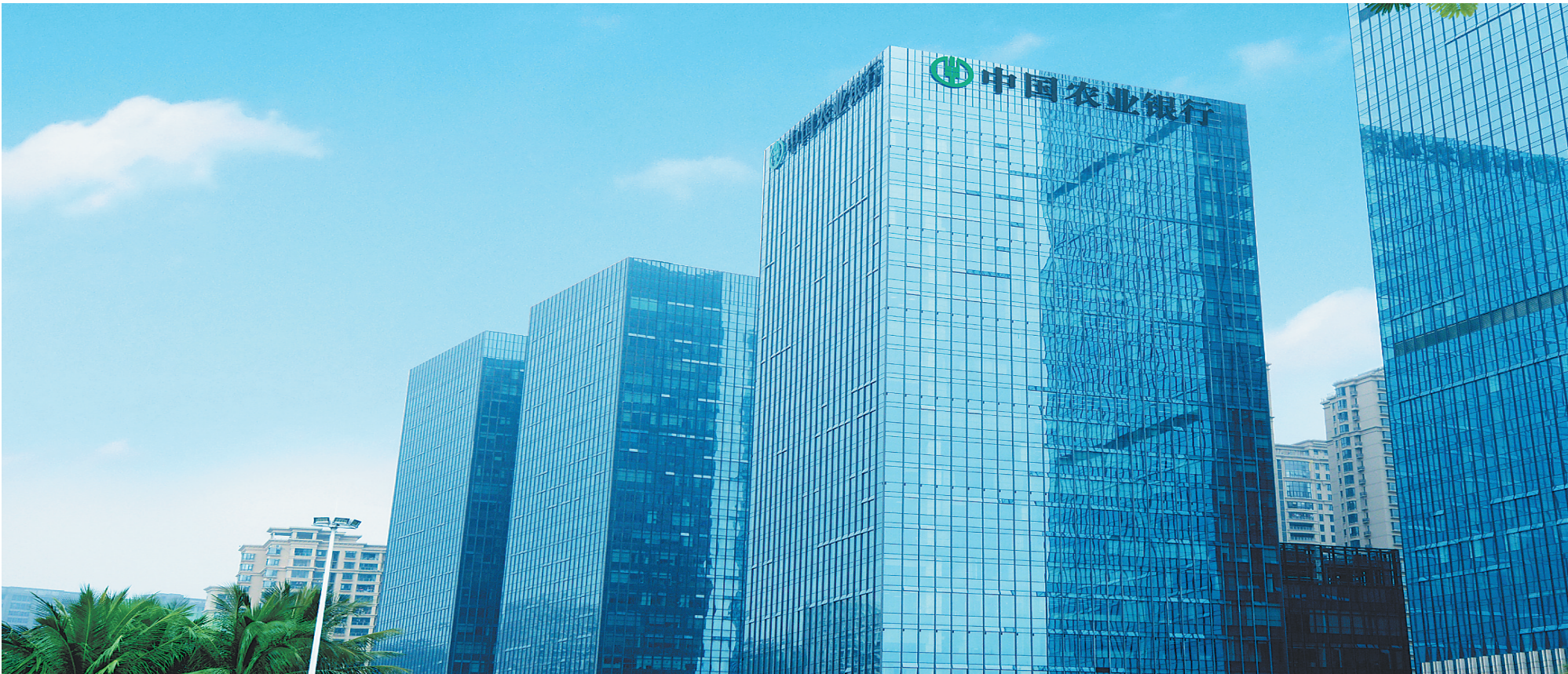
中国农业银行海南省分行