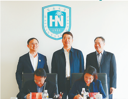
2019年12月14日，海南农行与海南大学签署全面战略合作协议。