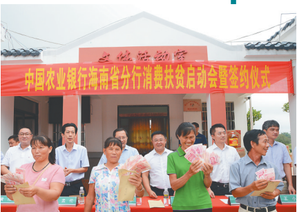
2018年10月17日，海南农行在定点扶贫村全面启动“消费扶贫”行动。