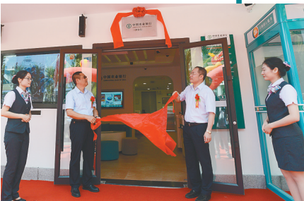
2019年6月28日，农行三沙分行开业。